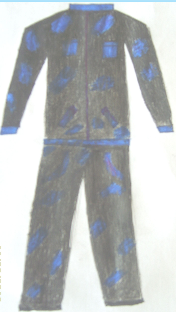
7 Б класс