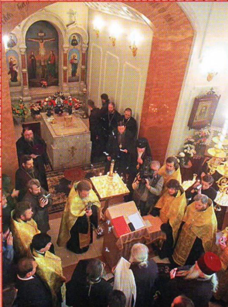
Молитва в часовне блаженной Ксении

Подвиги любви к ближним святая блаженная Ксения пронесла через всю свою многострадальную жизнь и получила любовь Божию в даре прозорливости и чудотворения, и любовь человеческую, которая не угасает уже второе столетие.