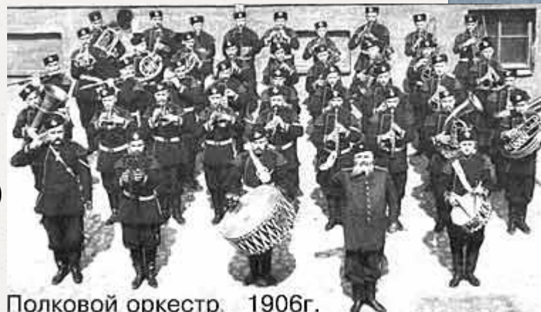
Полковой оркестр. 1906г.