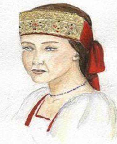
Деичья головная повязка. Центральная Россия. Конец 19 начало 20 века. (сукно,золотное шитьё,бисер) Историко-художественный музей г.Коломна.