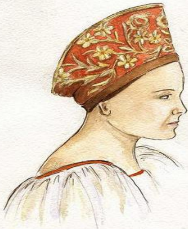
Кокешник.Московская губерния. Конец19 начало 20 века. (бархат,золотное шитьё) Историко-художественный музей г.Егор