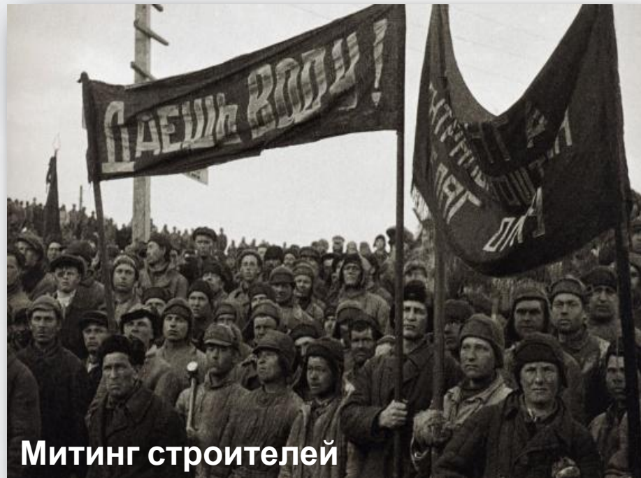
Митинг строителей Беломорканала

КОЛЛЕКТИВНОЕ, ПРЯМОЕ, ЛЕГАЛЬНОЕ, ПАССИВНОЕ, ПРИНУДИТЕЛЬНОЕ