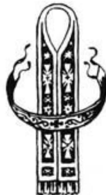
Епитрахиль и пояс

На руки священник надевает специальные поручи - узкие нарукавники, стягивающиеся шнурками. Символически они отождествляются с веревками на руках Иисуса Христа.