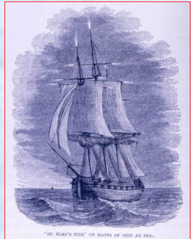
“ST. ELMO'S FIRE” ON MASTS OF SHIP AT SEA.

- разряд в форме светящихся пучков или кисточек, возникающих на острых концах высоких предметов (башни, мачты, одиноко стоящие деревья, острые вершины скал и т. п.) при большой напряжённости электрического поля в атмосфере. Название явление получило от имени покровителя моряков в католической религии.