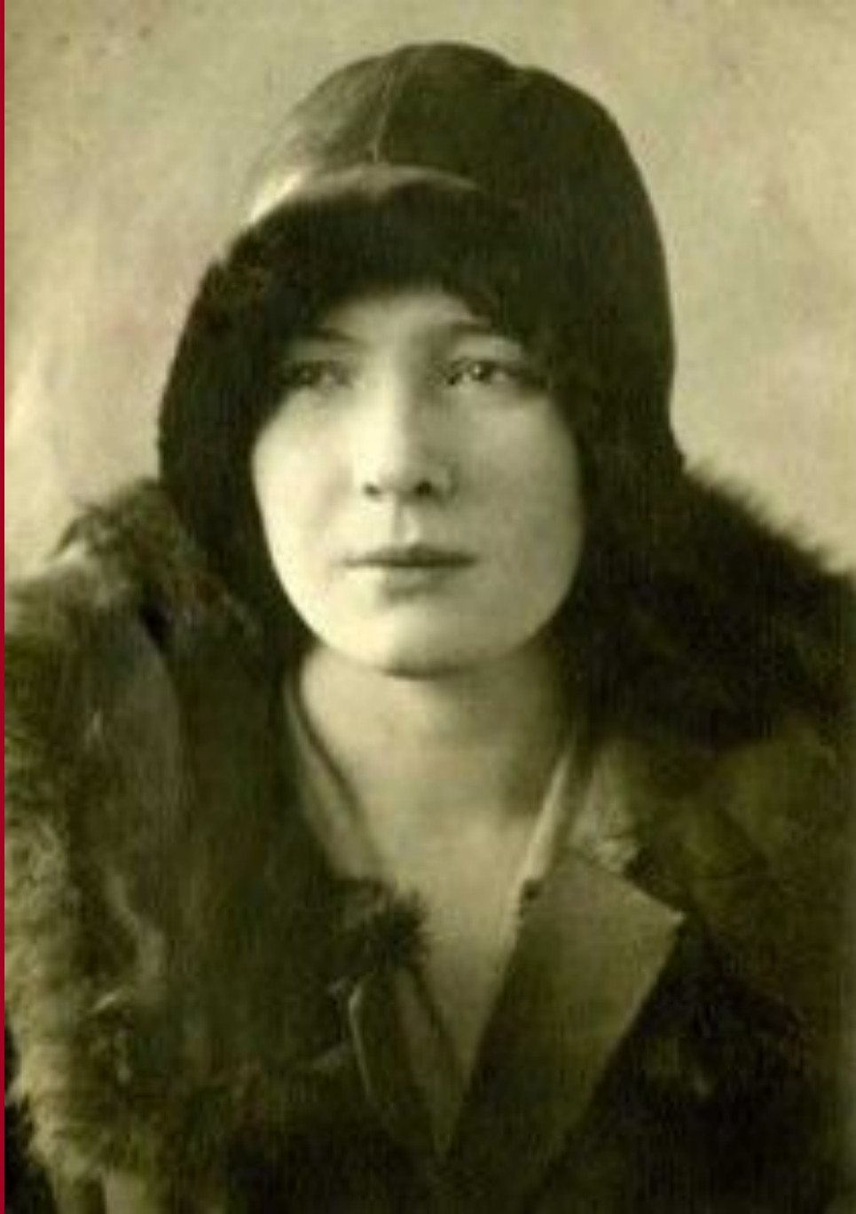
Университетское фото за несколько месяцев до отъезда в далекий Владикавказ. 1930 г.