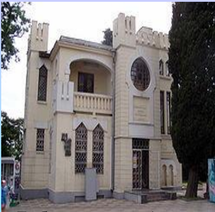
Библиотека им. А. С. Пушкина