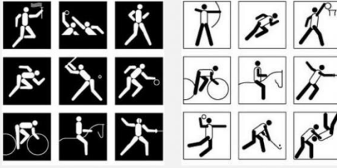
Лос Анджелес 1984