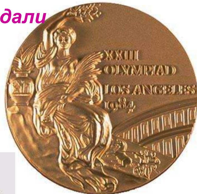
Лос Анджелес 1984