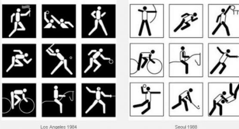
Los Angeles 1984