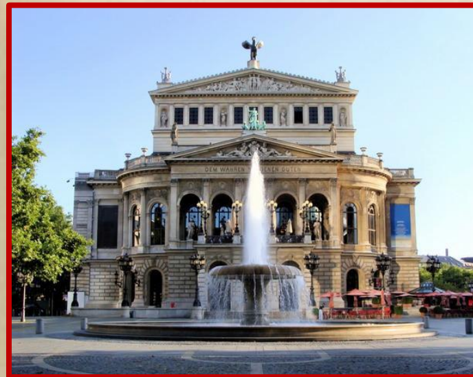
Старинное здание оперы

Опера появилась в Италии, в мистериях, то есть духовных представлениях, в которых эпизодически вводимая музыка стояла на низкой ступени. Духовная комедия: «Обращение св. Павла» (1480), Беверини, представляет уже более серьёзный труд, в котором музыка сопровождала действие с начала до конца. В середине XVI века большой популярностью пользовались пасторали или пастушеские игры, в которых музыка ограничивалась хорами, в характере мотета или мадригала. В «Amfiparnasso», Орацио Векки хоровое пение за сценой, в форме пятиголосного мадригала, служило для сопровождения игры актёров на сцене. Эта «Commedia armonica» была дана в первый раз при Моденском дворе в 1597 году.