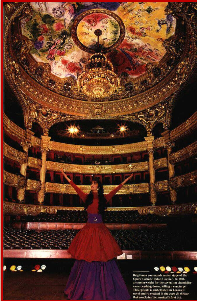
Brightman commands center stage of the Opera's ornate Palais Garnier. In 1896, a counterweight for the seven-ton chandelier came crashing down, killing a concierge. This episode is embellished in Leroux's novel and re-created in the coup de théâtre that concludes the musical's first act.

В конце XVI века попытки ввести в такие сочинения одноголосное пение ( монодию ) вывели оперу на тот путь, на котором её развитие быстро пошло вперед. Авторы этих попыток называли свои музыкально-драматические произведения drama in musica или drama per musica ; название «опера» стало применяться к ним в первой половине XVII века. Позднее некоторые оперные композиторы, например Рихард Вагнер , опять вернулись к названию «музыкальная драма».