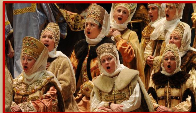
Опера «Борис Годунов»