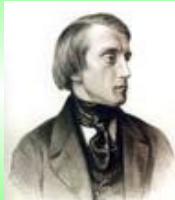
В. Г. Белинский

Близость к подлиннику состоит в предании не буквы, а духа создания. Каждый язык имеет свои, одному ему принадлежащие средства, особенности и свойства до такой степени, что для того, чтобы передать верно иной образ или фразу, в переводе их должно совершенно изменить. Соответствующий образ, так же, как и соответствующая фраза, состоит не всегда в видимой соответствии слов, надо чтобы внутренняя жизнь переводного выражения соответствовала жизни подлинника.