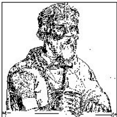
ВЛАДИМИР СВЯТОСЛАВИЧ КРАСНОЕ СОЛНЫШКО

Идеальный князь, правитель, объединяющий вокруг себя всё лучшее и организующий защиту Киева и всей Руси от внешних сил.