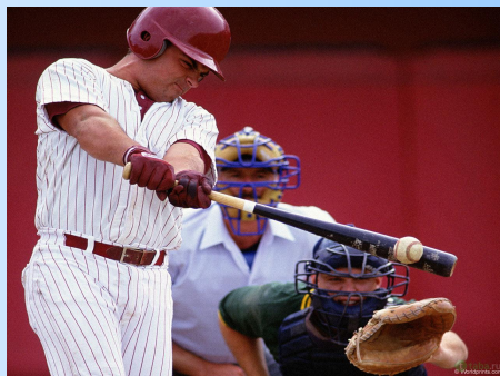
у американцев – бейсбол