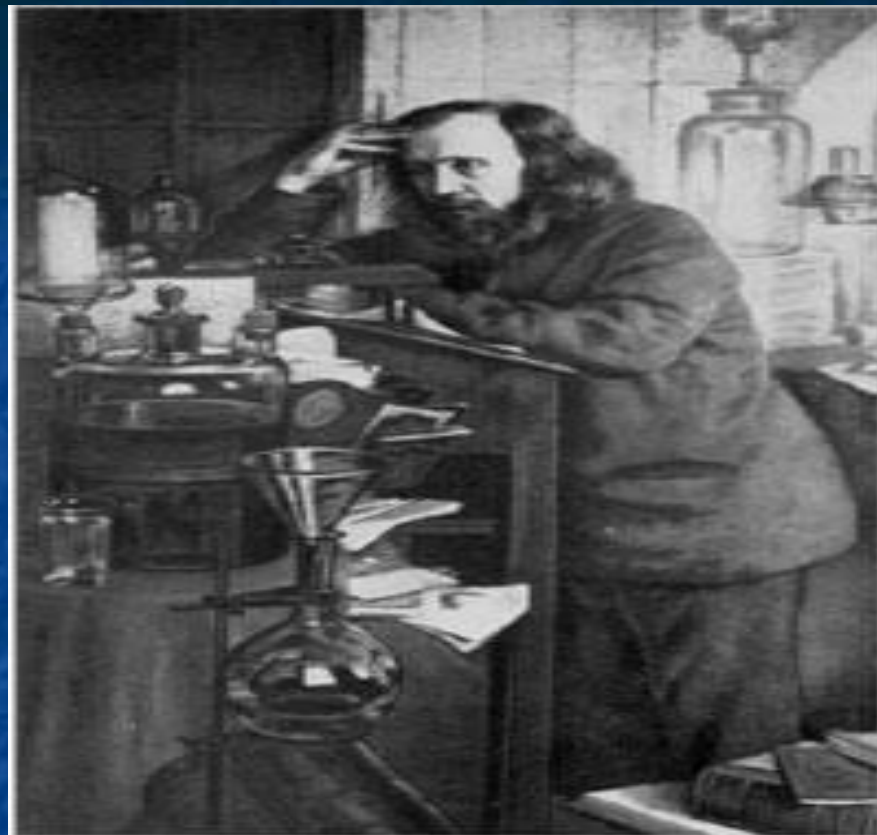
Д.И.Менделеев. Портрет работы Н.А.Ярошенко