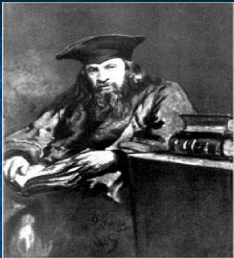
Д.И.Менделеев в мантии доктора прав Эдинбургского университета. Портрет работы И.Е. Репина