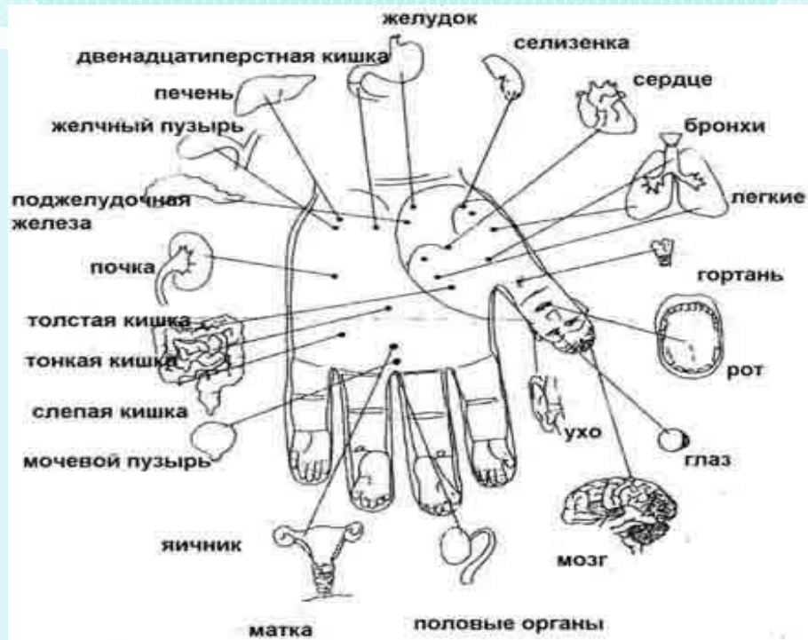
Внутренние органы в основной системе соответствия кисти.