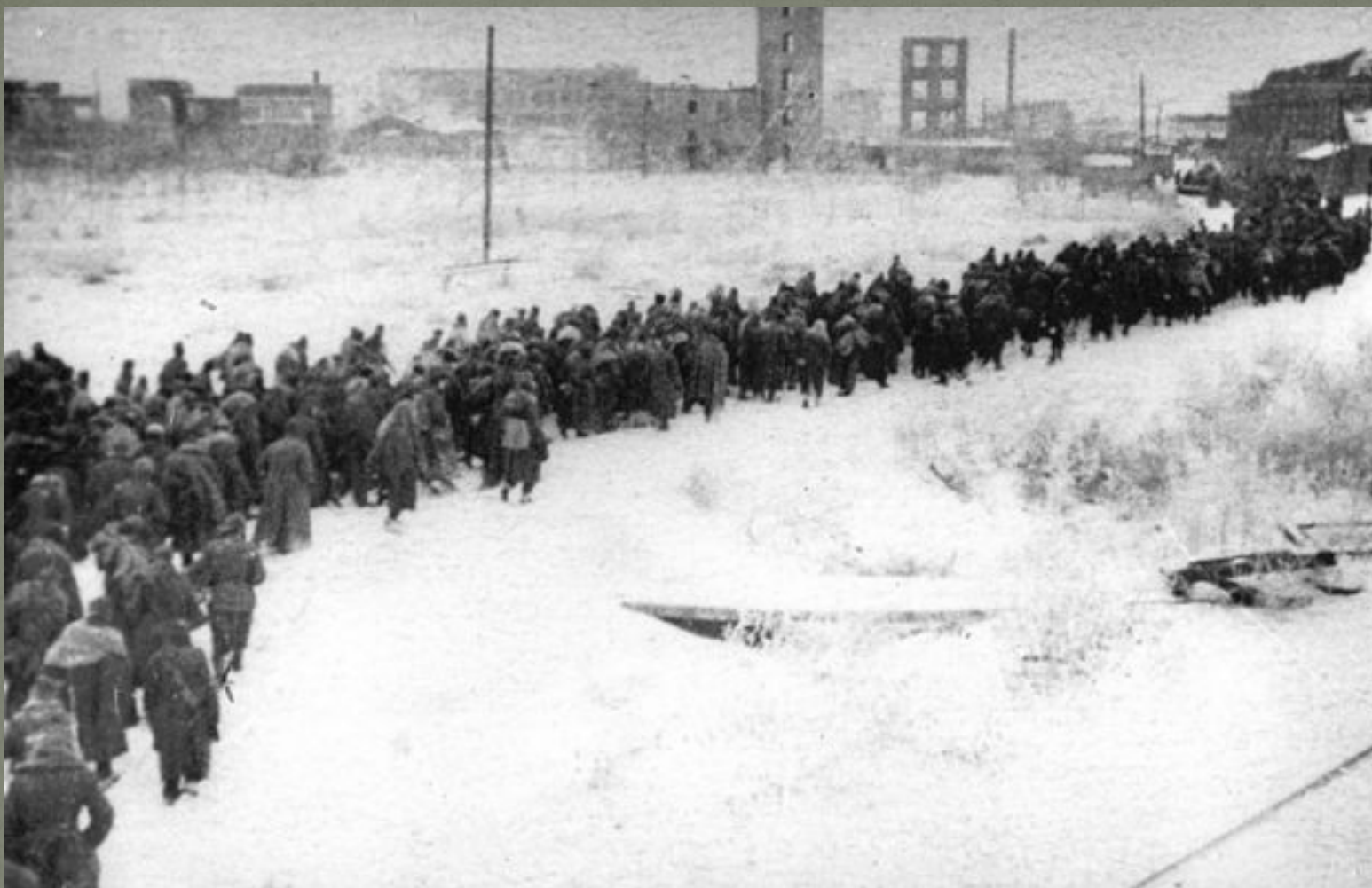
Сталинград Пленные немцы 1943