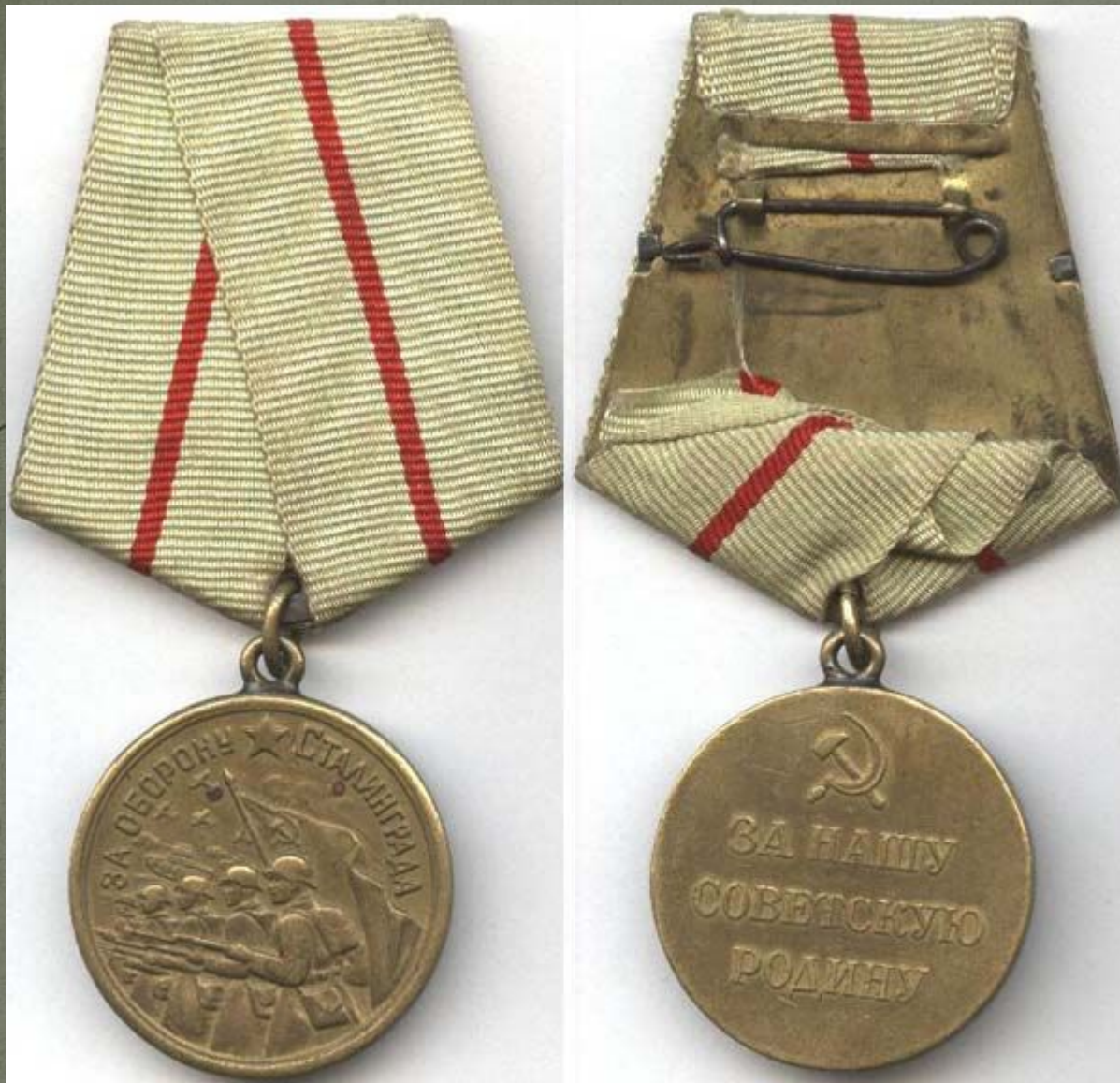
МЕДАЛЬ "ЗА ОБОРОНУ СТАЛИНГРАДА.