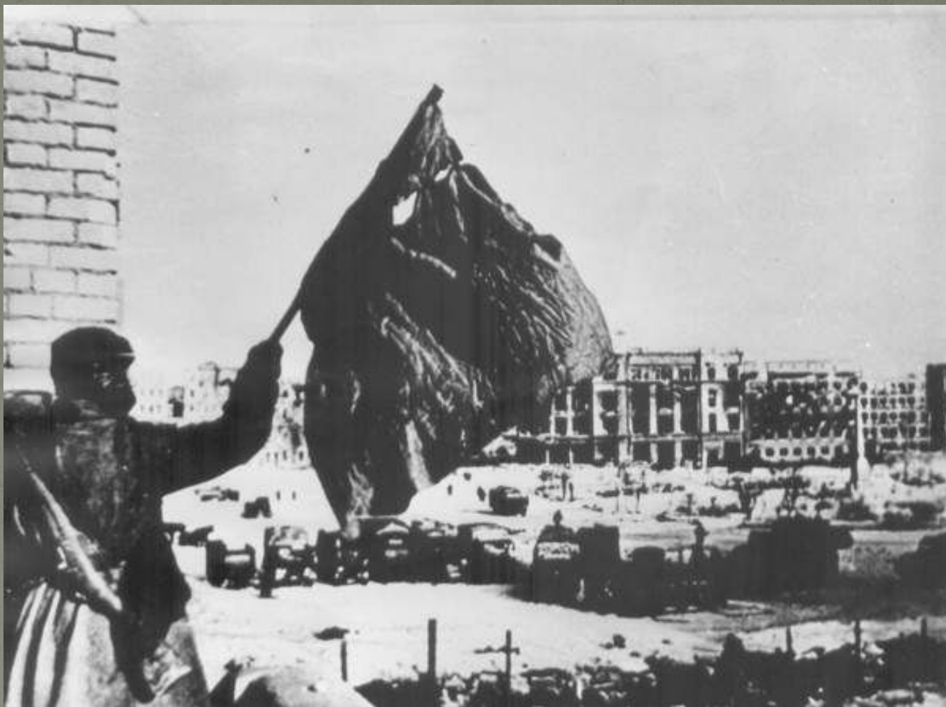
Флаг победы над Сталинградом