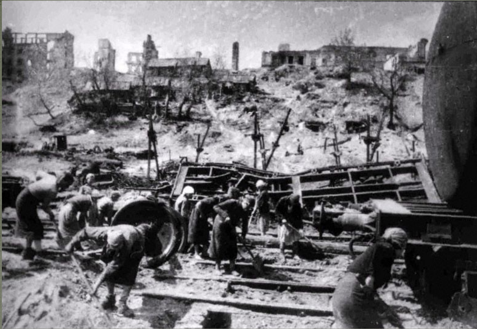
Возвращение, Сталинград, 1943 год.