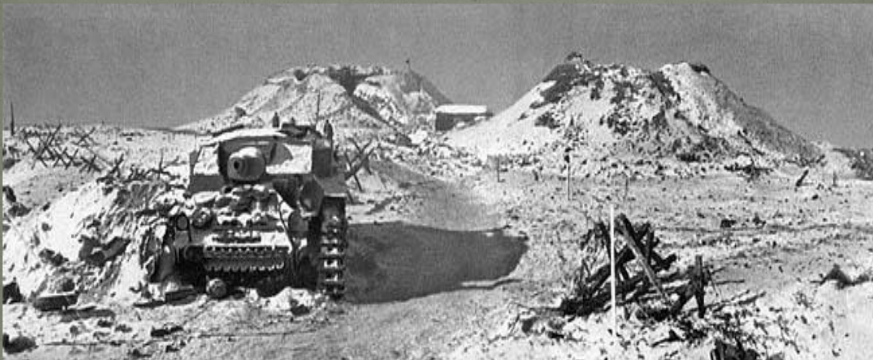
Мамаев курган после окончания боев