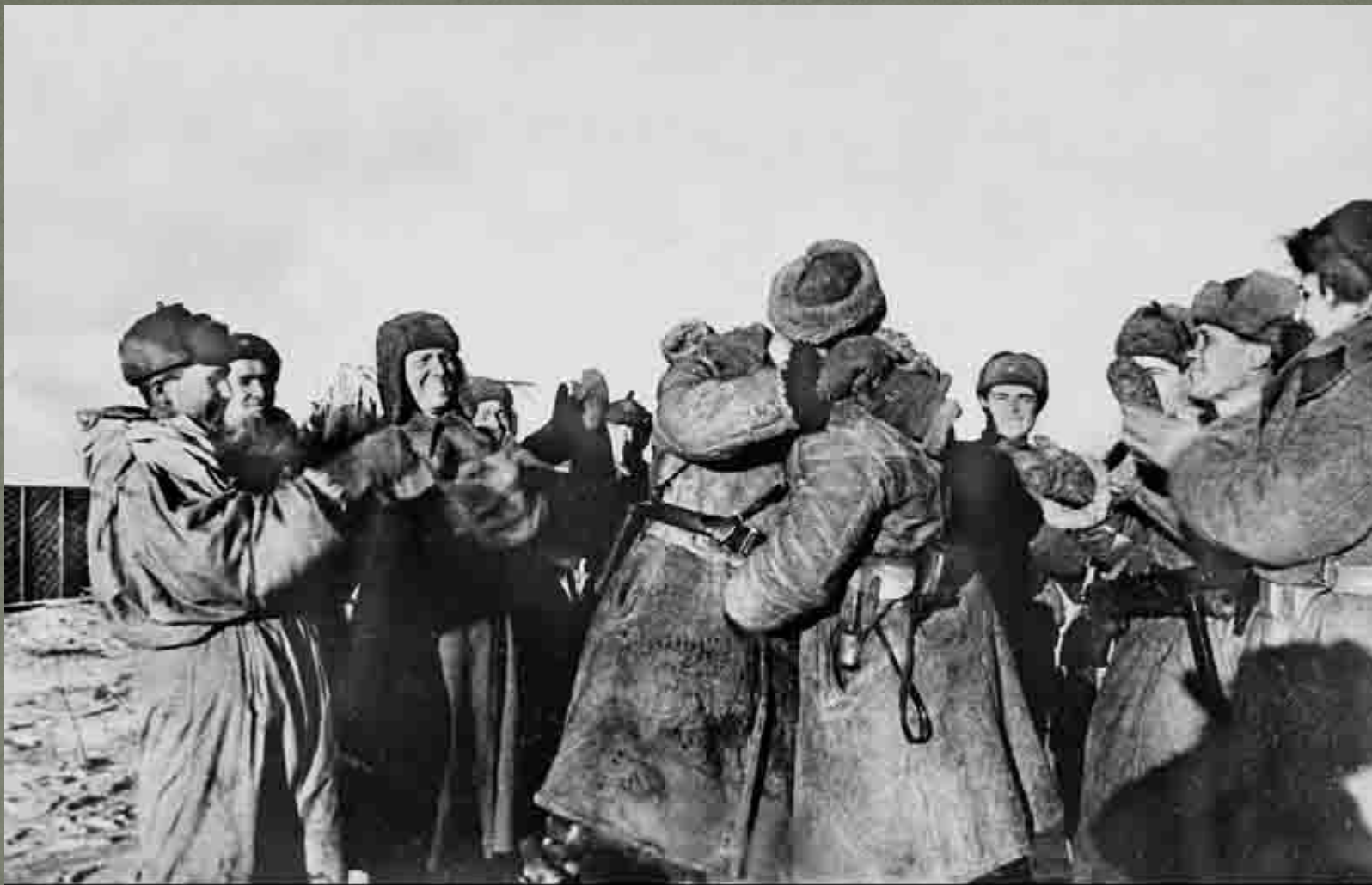
Встреча бойцов двух фронтов под Сталинградом.