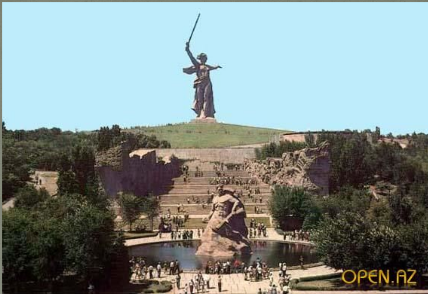
Историко-мемориальный комплекс Мамаев курган