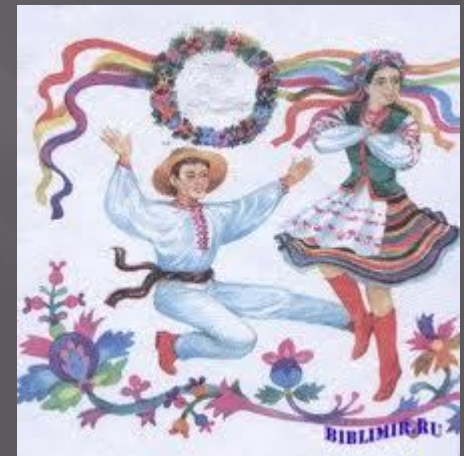
Картинка до твору “Орися”