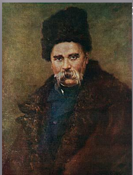
Т. Шевченко Товариш П. Куліша