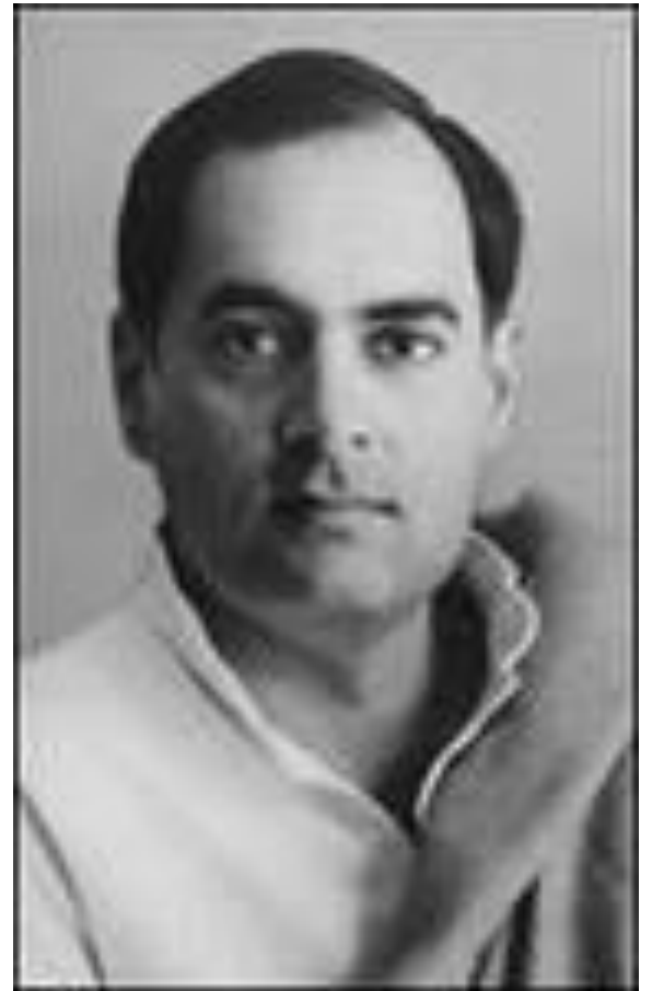
Д. Неру –