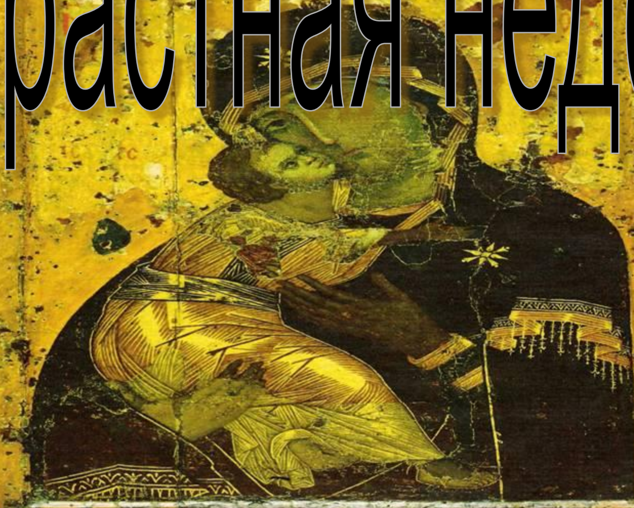
Владимирская Богоматерь. Начало XII в.