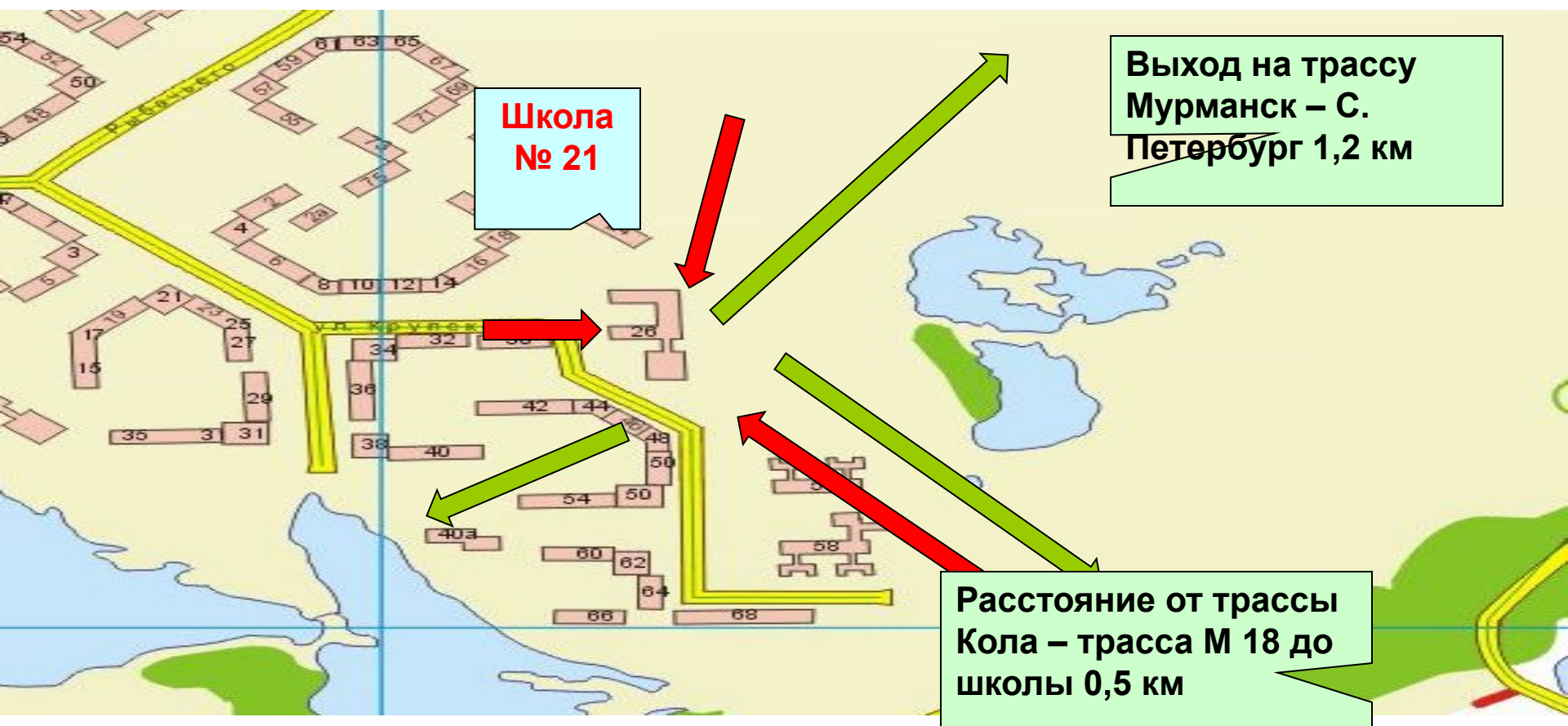
Схема наиболее вероятного проникновения на территорию образовательного учреждения школы № 21 г. Мурманска и отхода террористов во время проведения террористической акции