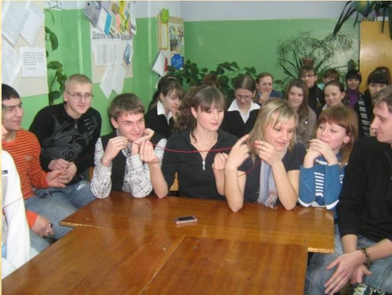
Профориентационная игра «Перспектива успеха» Встреча выпускников разных лет со старшеклассниками МОУ СОШ № 1 г.Окуловка