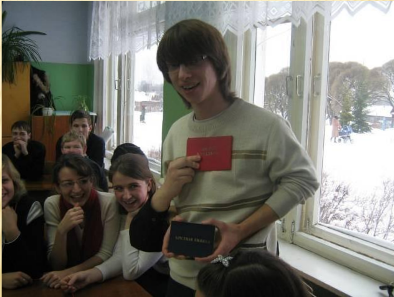
Встреча выпускников разных лет со старшеклассниками МОУ СОШ № 1 г.Окуловка