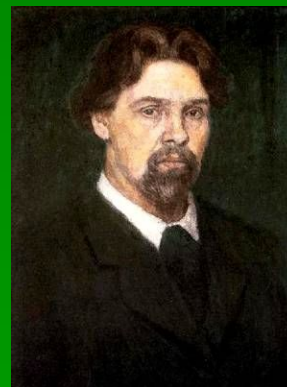
В. И. Суриков