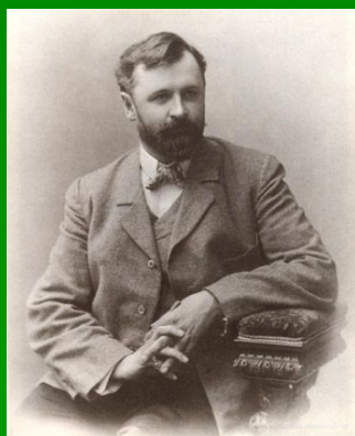
К. А. Коровин