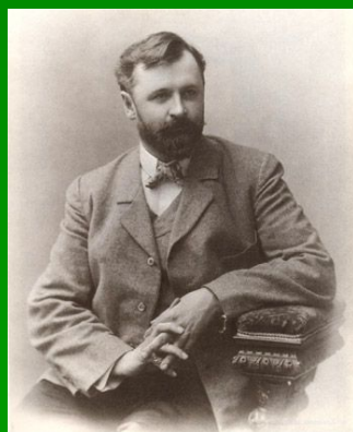
К. А. Коровин