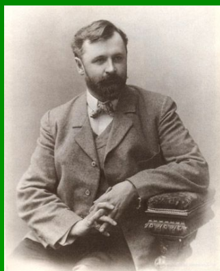
К. С. Станиславский