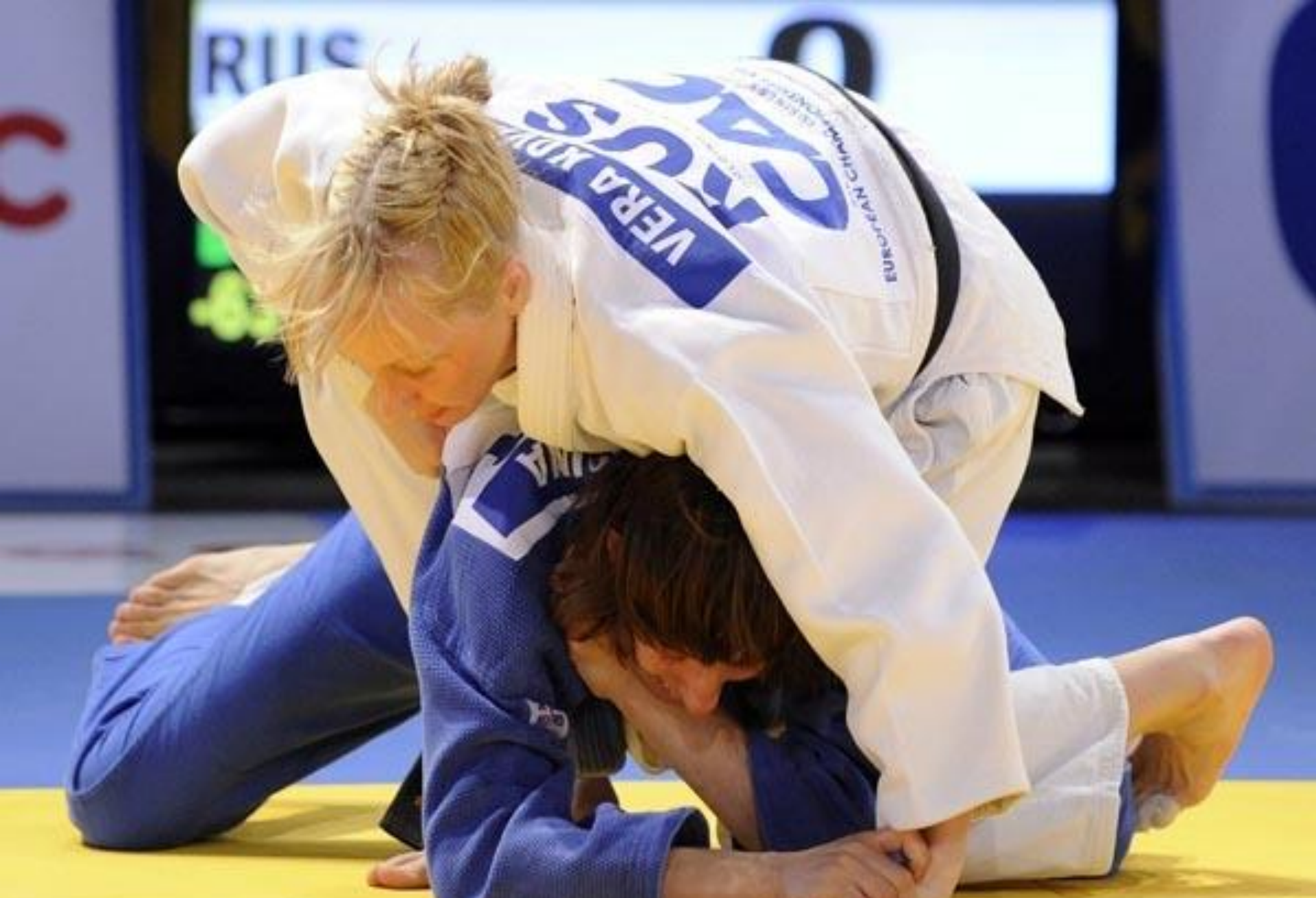
Дзюдо, женщины (7)