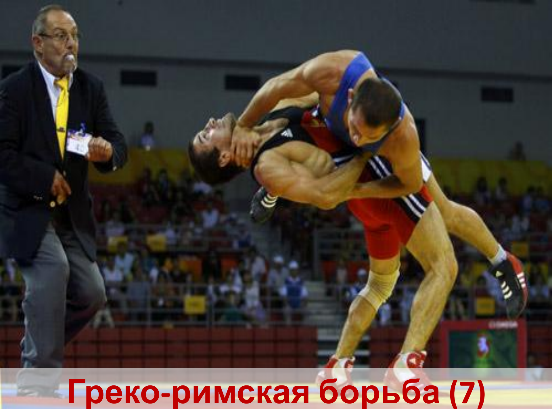
Греко-римская борьба (7)