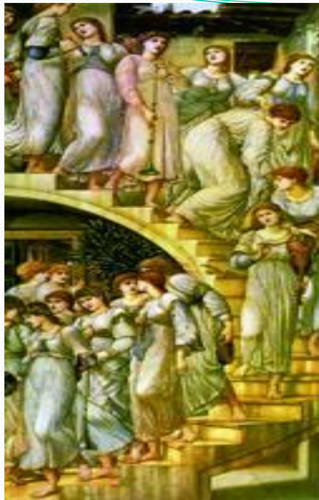
Э. К. Бёрн-Джонс. Золотые ступени. 1880