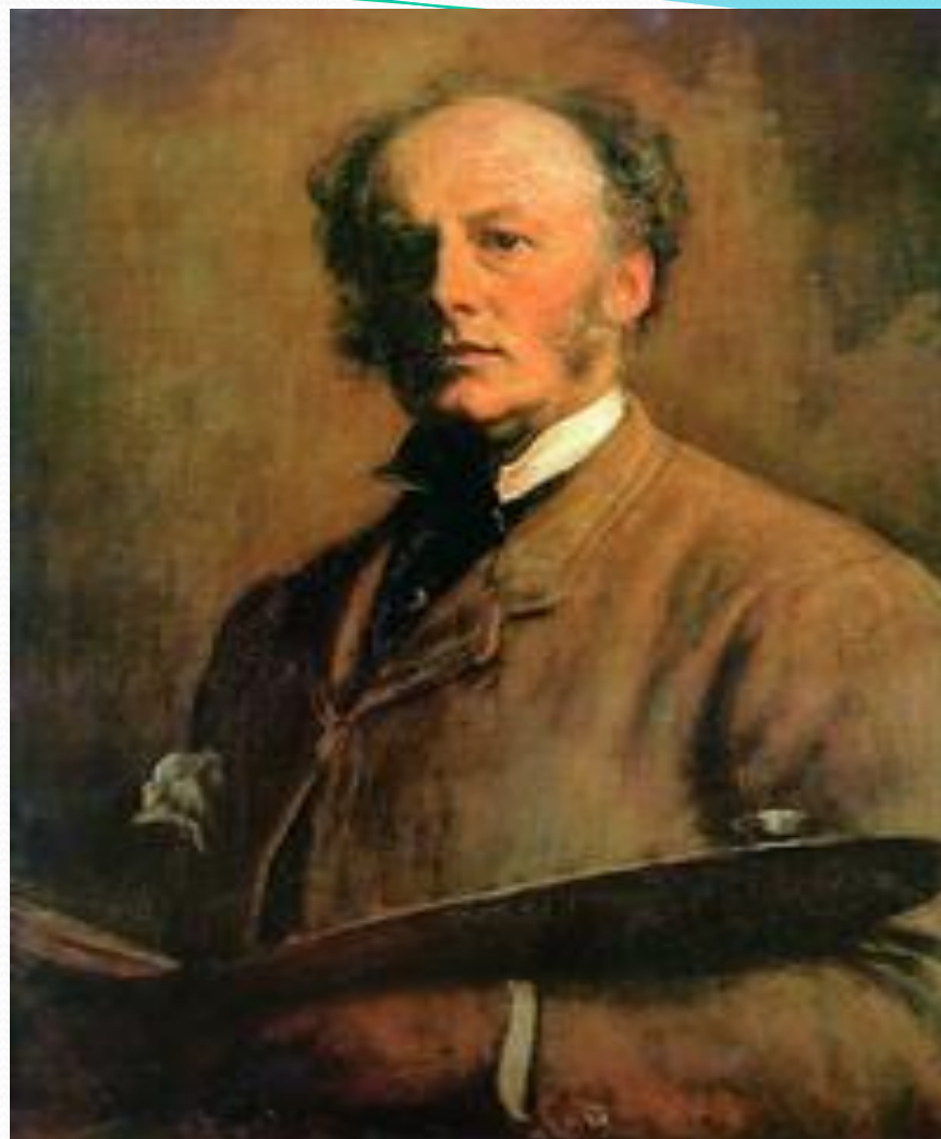
Джон Эверетт Миллес. Автопортрет. 1880