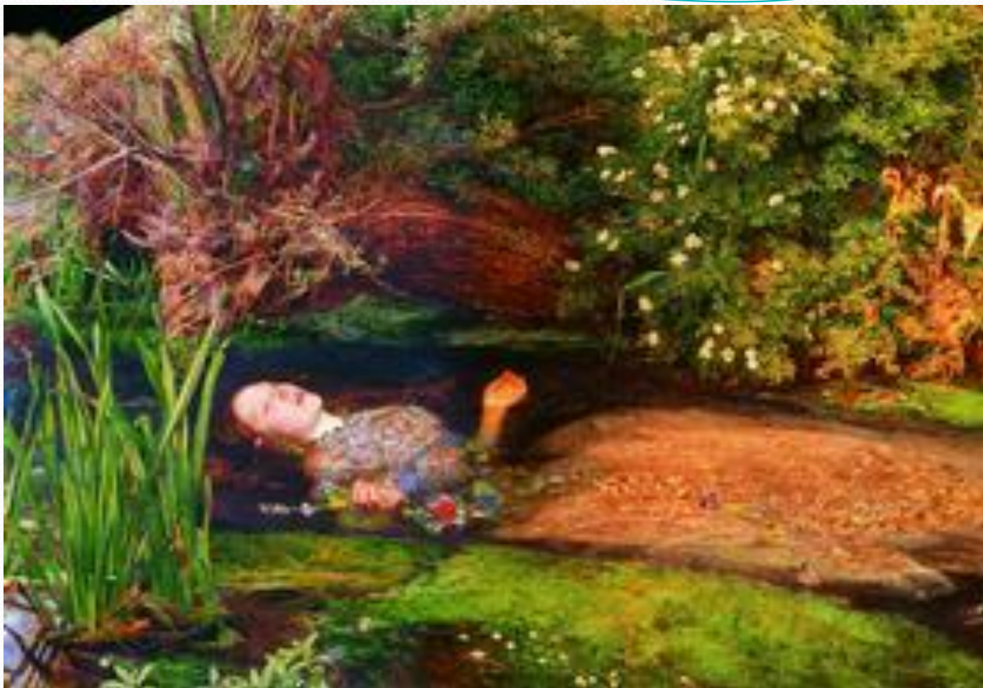
Дж. Э. Миллес. Офелия. 1852