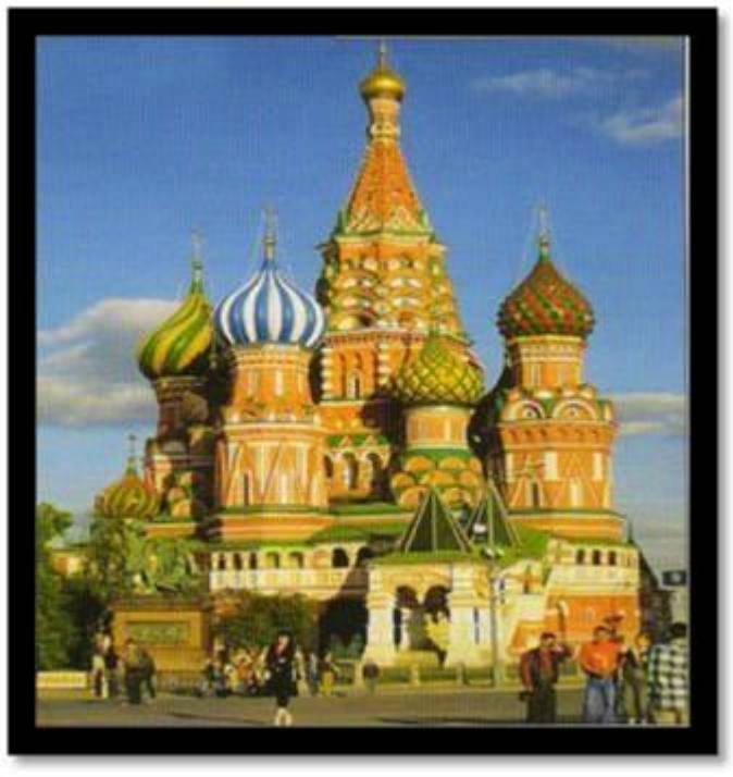
Собор Василия Блаженного