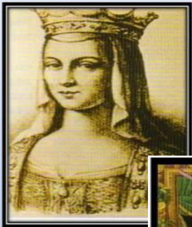
Anne de Kiev Анна Ярославна