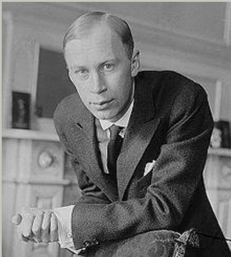
Сергей Прокофьев (1891 – 1953)