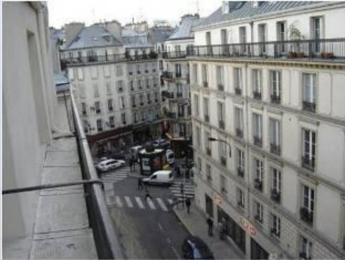
Rue de Moscou Улица Москвы