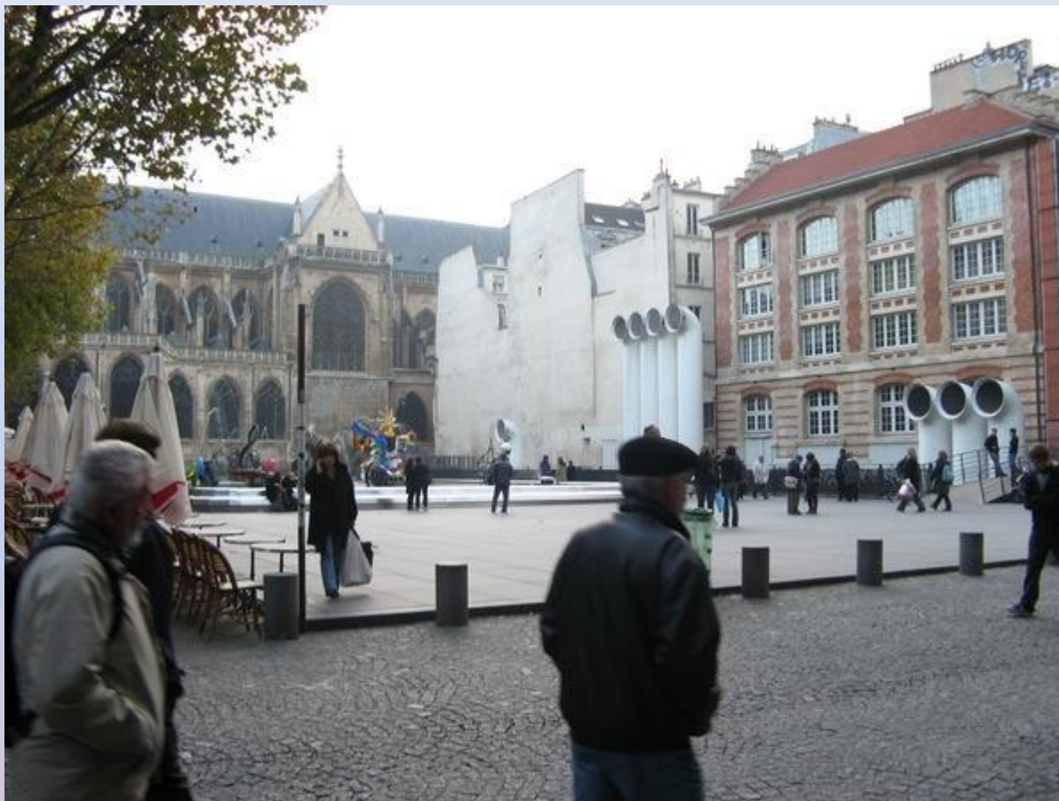
La Place d'Igor Stravinski Площадь Игоря Стравинского