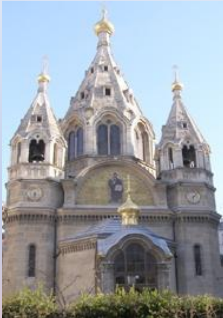
La cathedrale d'Alexandre Nevski Православный собор Александра Невского