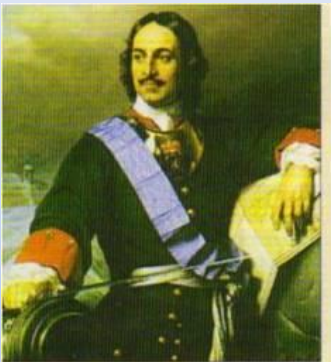
Pierre I er (1672-1725)