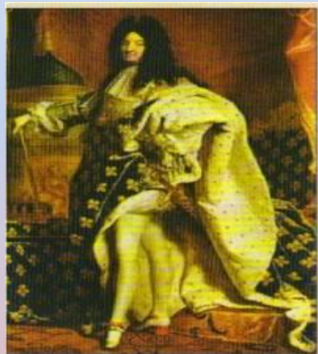
Louis XIV (1638-1715)