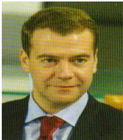
Николя Саркози, Президент Французской Республики

« Открыть новые и полезные перспективы сотрудничества»