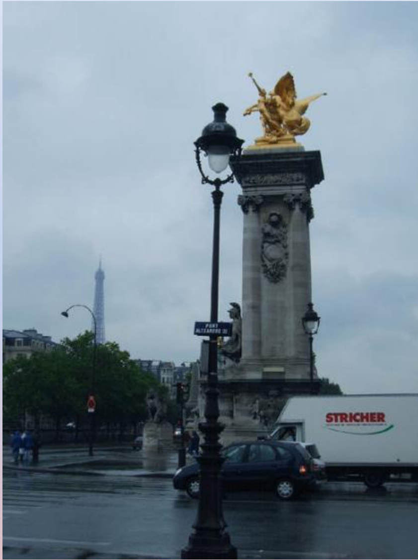
Мост Александра Pont d'Alexandre III