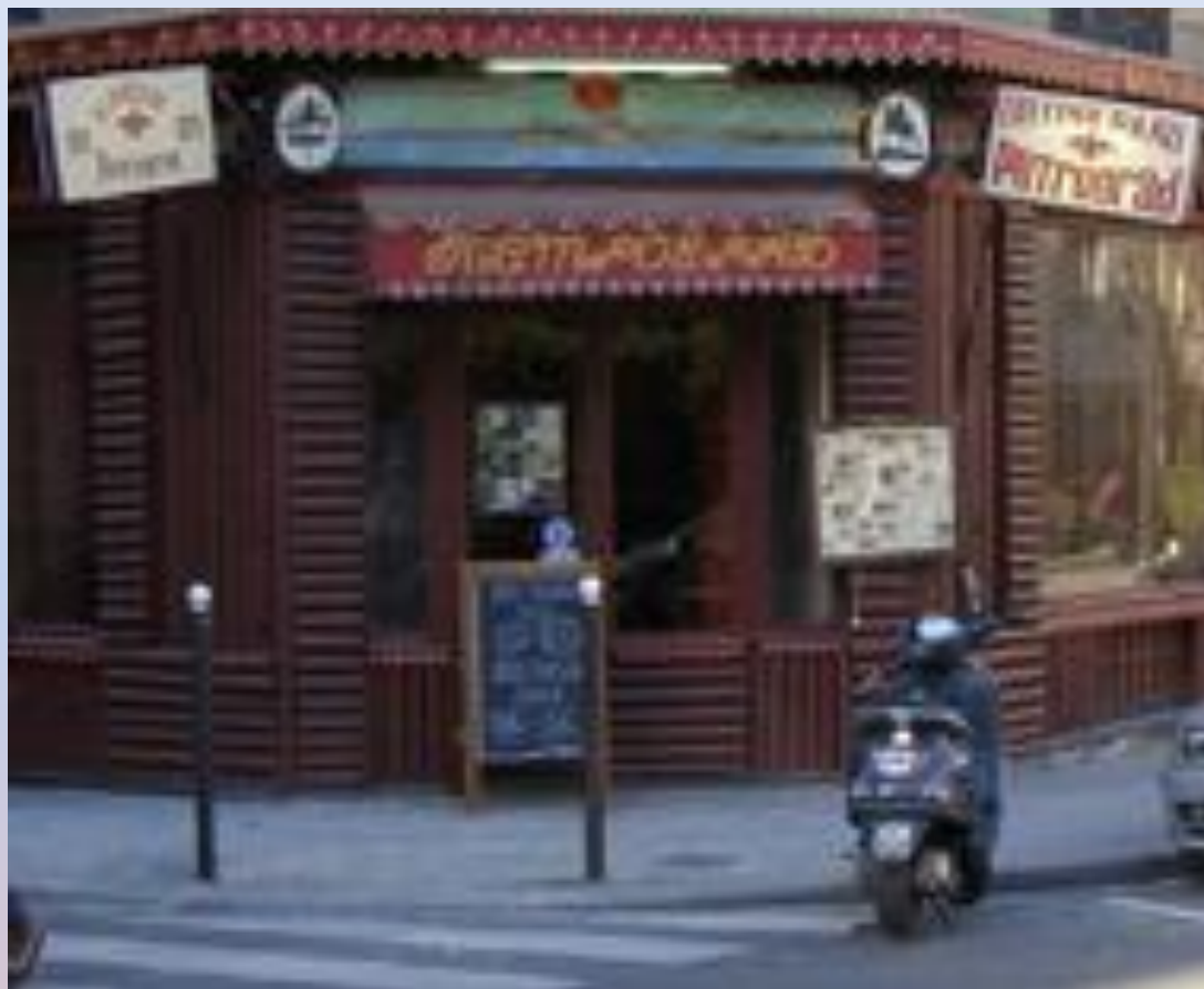
Restaurant "A Petrograd" Ресторан «В городе Петрограде»