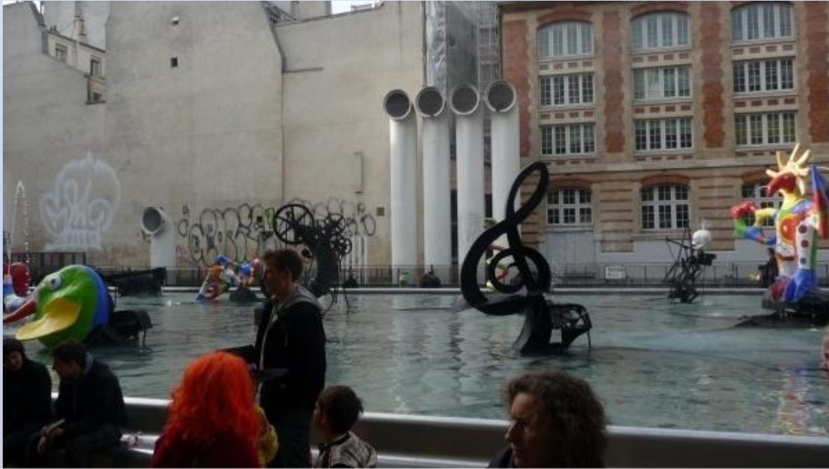
Фонтан на площади Игоря Стравинского