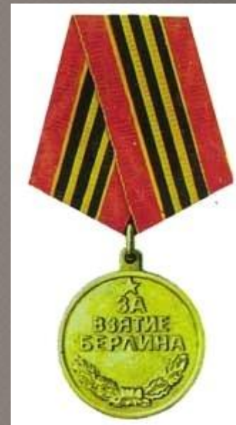
Медаль «За взятие Берлина»