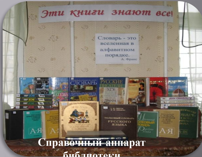
Справочный аппарат библиотеки