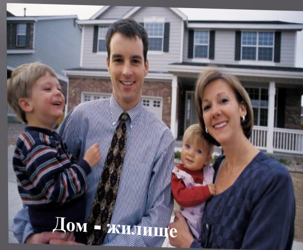
Дом - жилище