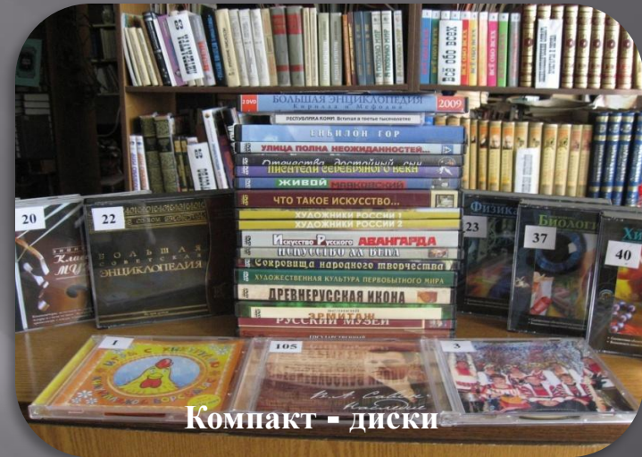
Компакт - диски