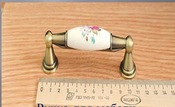
Ручка для мебели