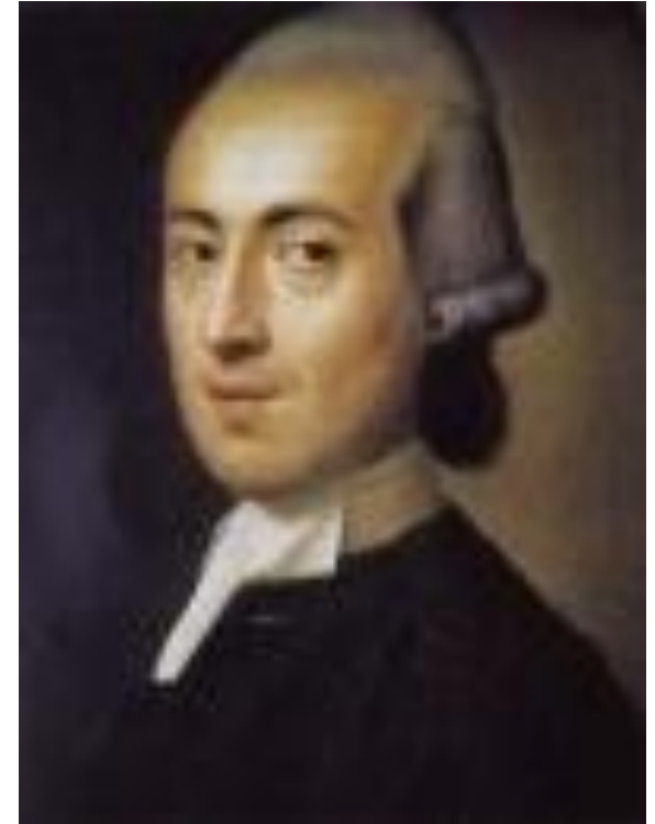
ИОГАНН ГЕРДЕР 25.08.1744 – 00.00.1803

Термин «политическая культура» впервые появился лишь в XVIII в. в трудах немецкого философа-просветителя Иоганна Гердера. Теория же, предполагавшая изучение мира политики через призму этого концепта, сформировалась еще позднее -только в конце 50-60-х гг. XX в. и получила развитие в работе американского политолога Германа Файнера «Системы правления великих европейских государств» 1956 г. Позднее была опубликована книга американских авторов Г. Алмонда и С. Вербы «Гражданская культура» (1963 г.).