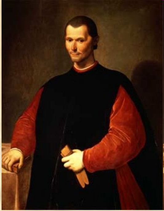
Никколо Макиавелли, XV в.

1. « Государи, когда дело идёт о единстве их подданных, не должны бояться прослыть жестокими.»