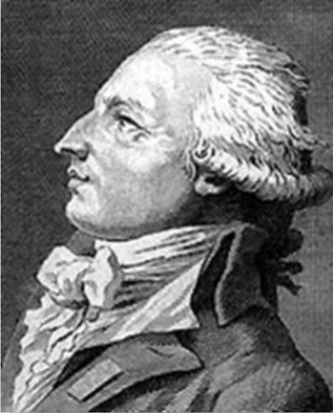
Дестют де Траси 1754-1836

Идеология – (от греч. Idea – идея, образ и logos – слово, понятие) – совокупность политико-правовых и нравственно-философских взглядов на общественно-историческую действительность