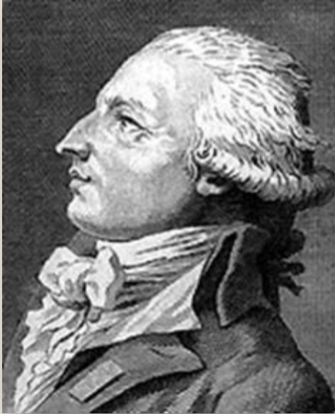
Дестют де Траси 1754-1836

Идеология – (от греч. Idea – идея, образ и logos – слово, понятие) – совокупность политико-правовых и нравственно-философских взглядов на общественно-историческую действительность