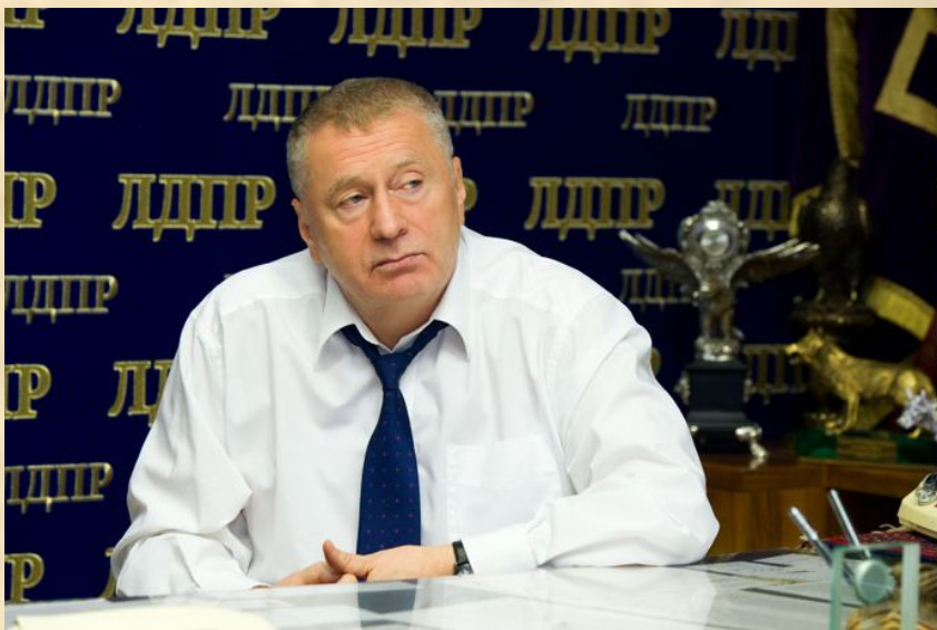
Председатель - ЖИРИНОВСКИЙ Владимир Вольфович.