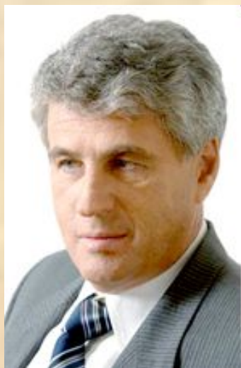
Гозман Леонид Яковлевич