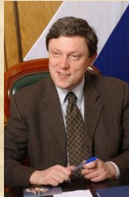
Явлинский Григорий Алексеевич (председатель до 2008)