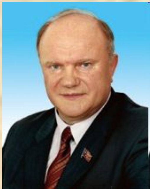
Председатель – ЗЮГАНОВ Геннадий Андреевич.