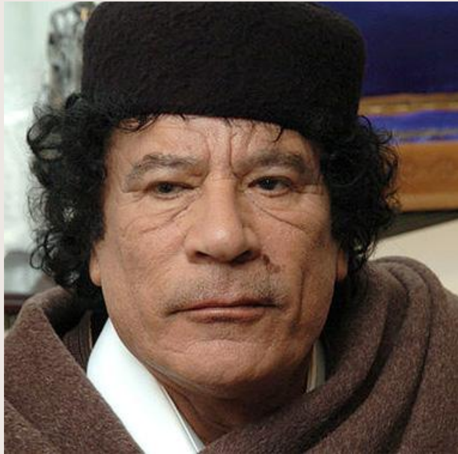
Муамар Каддафи (Ливия)