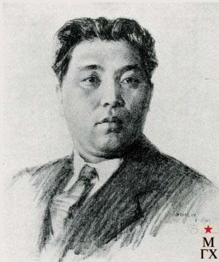
Ким Ир Сен (КНДР)