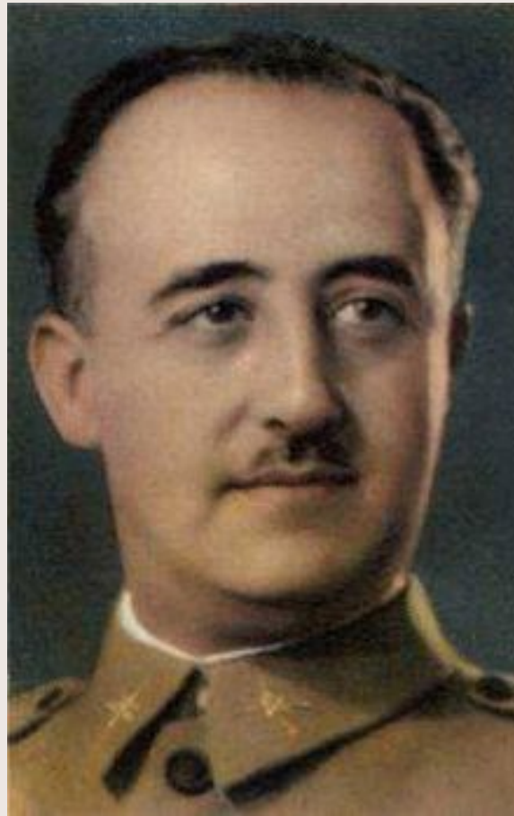
Франсиско Франко (Испания)