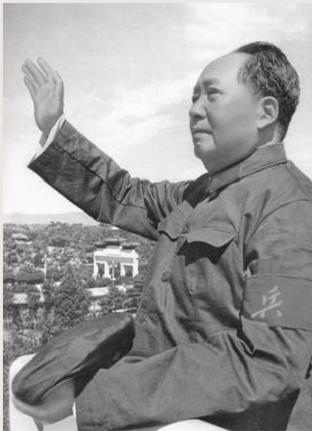
Мао Цзэдун (Китай)