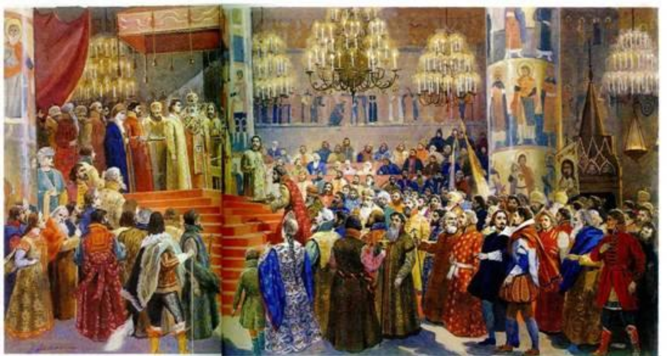
Венчание Михаила Романова на царство. 1613 год .