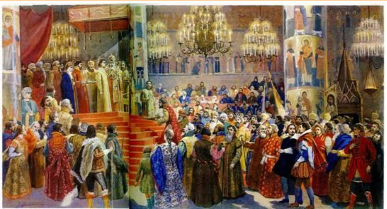
Венчание Михаила Романова на царство. 1613 год .