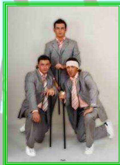
Современный танцевальный коллектив