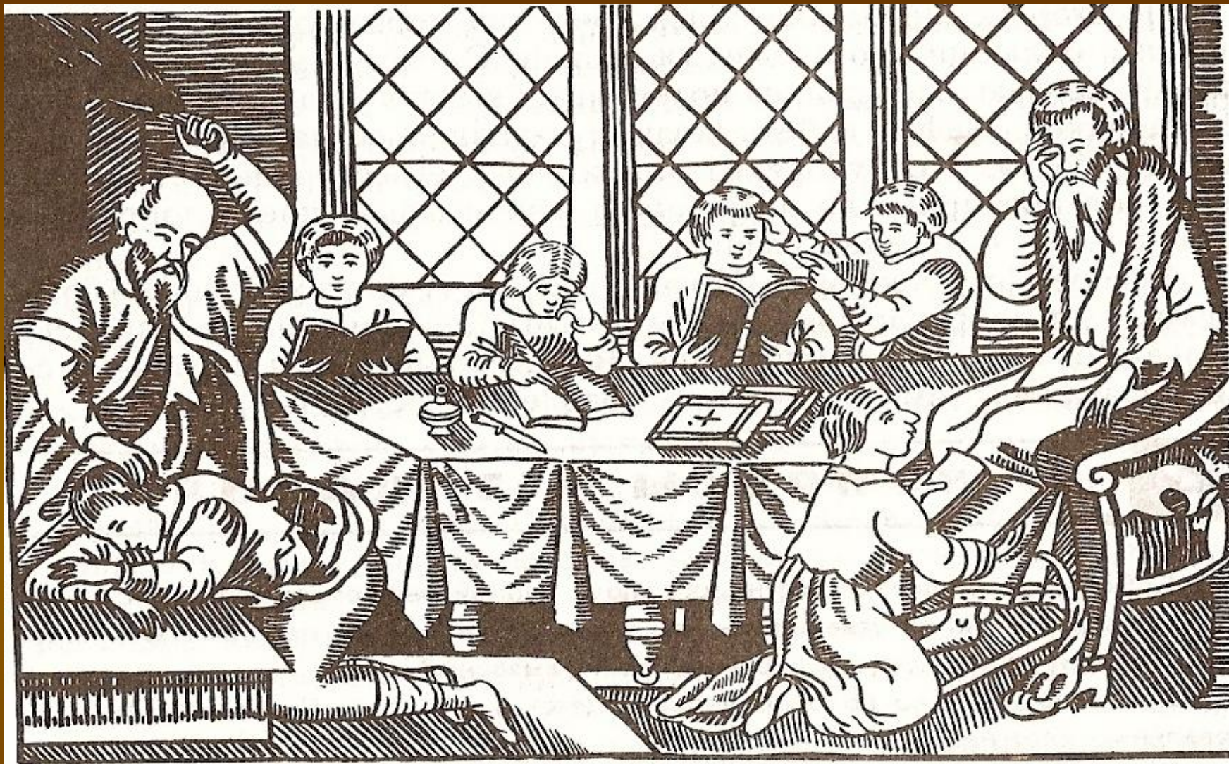
Школа XVII в.