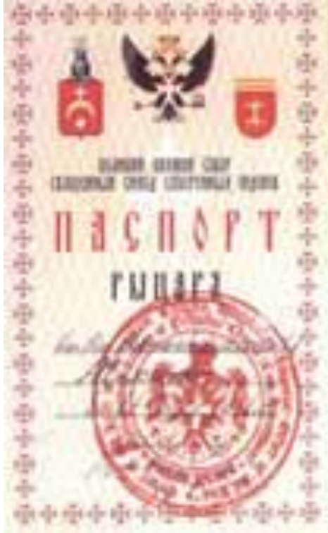
Старинный Мальтиский паспорт