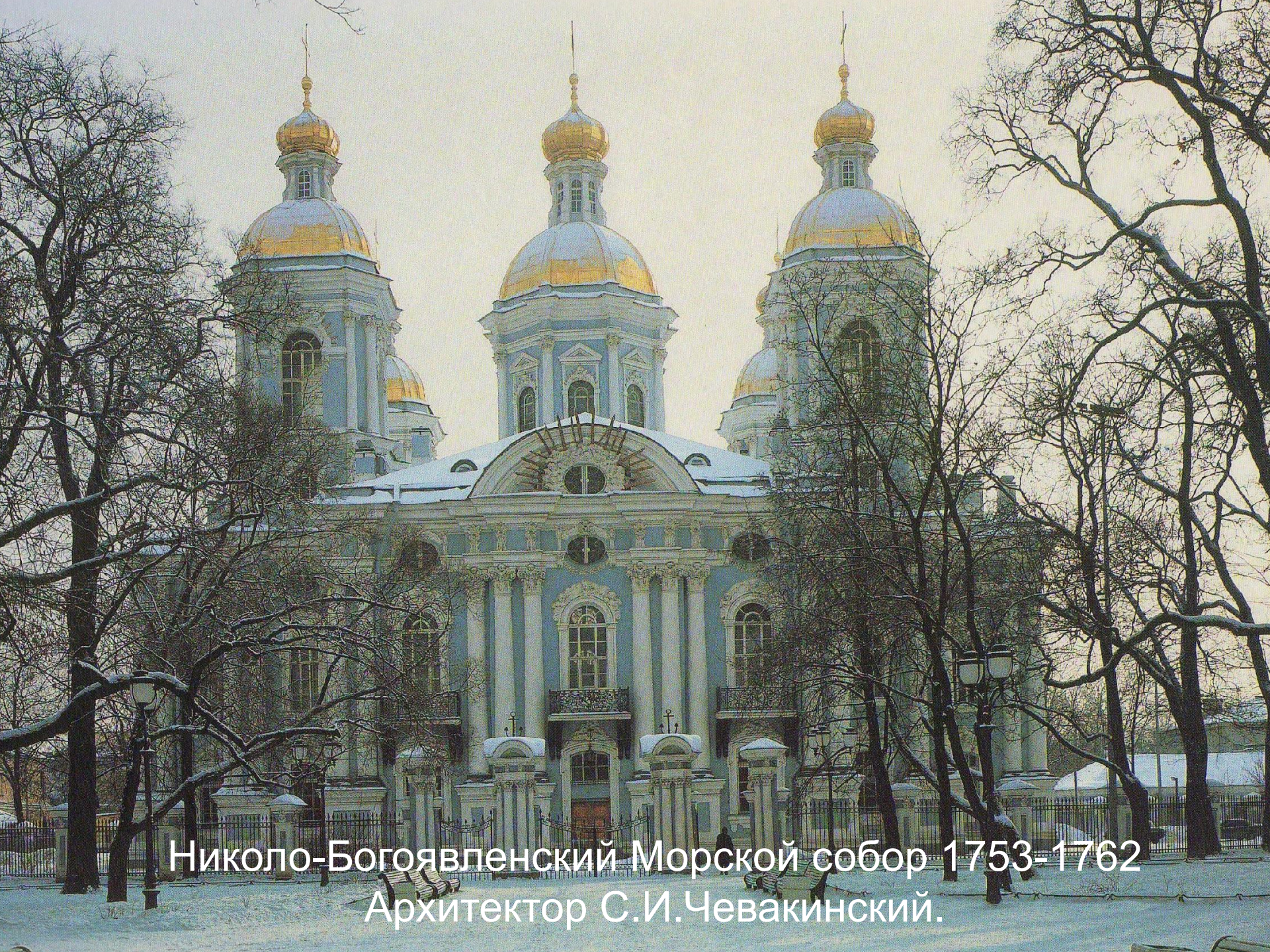
Никола-Богоявленский Морской собор 1753-1762 Архитектор С.И.Чевакинский.