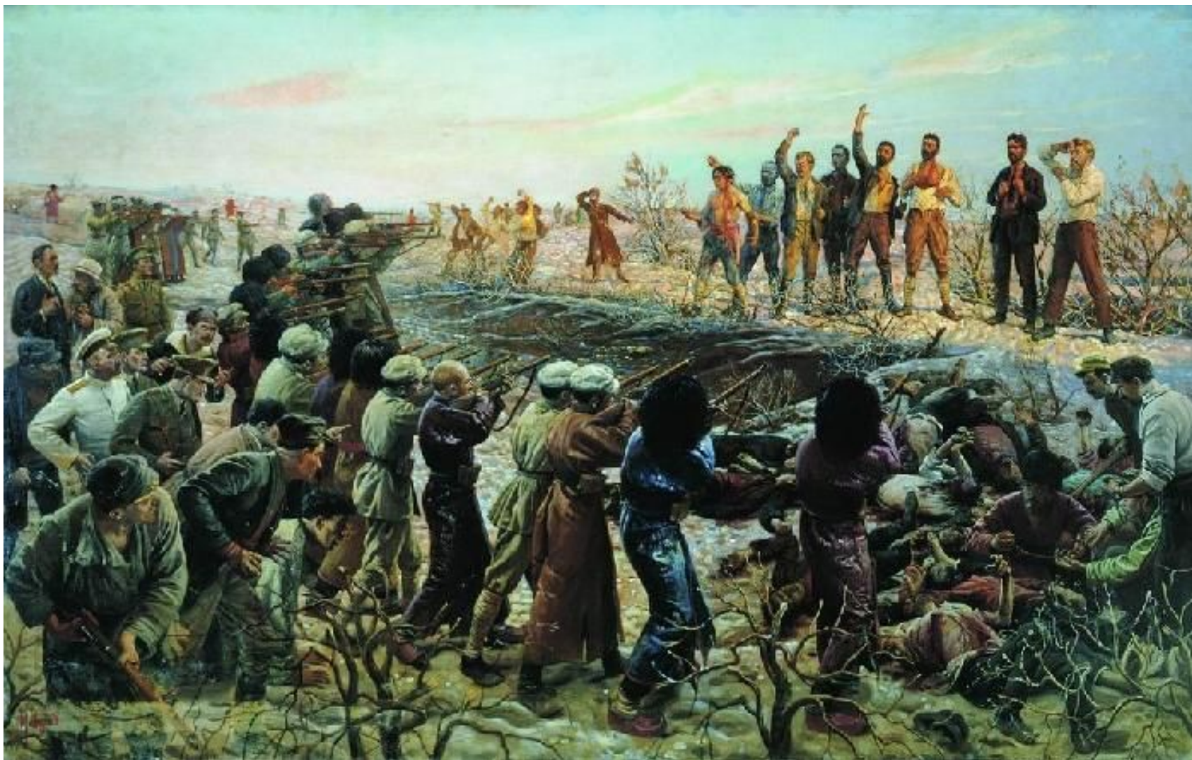
И.И.Бродский "Расстрел 26 бакинских комиссаров"