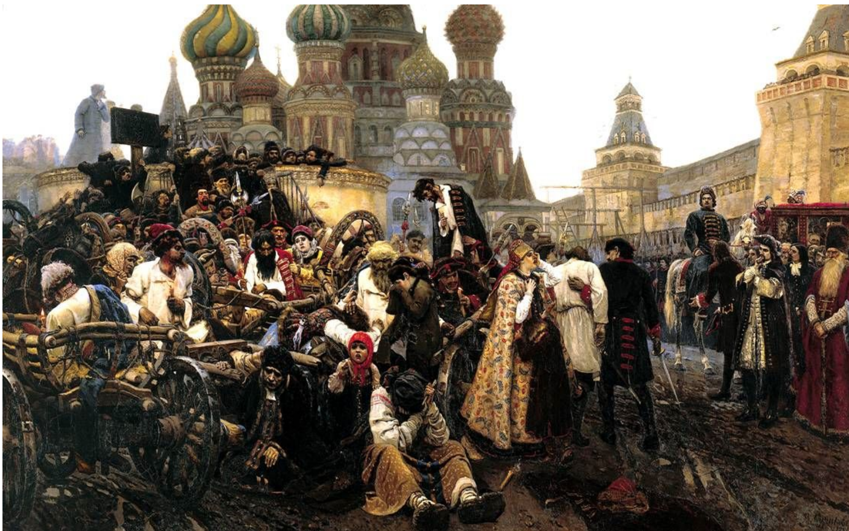
В. И Сурикова "Утро стрелецкой казни"