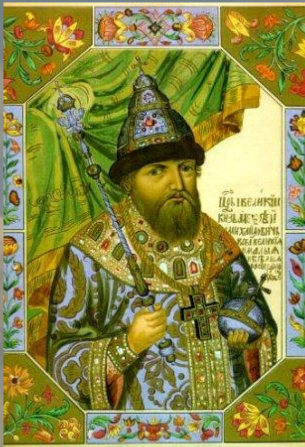
Царь Алексей Михайлович (1629 – 1676).

Традиция обмена крашеными яйцами на Пасху имеет в России давние корни. Известно, что во времена правления царя Алексея Михайловича для раздачи на Пасху было приготовлено до 37 тысяч яиц.