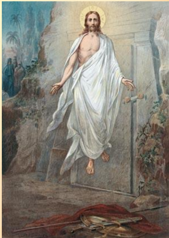
Воскрешение Господа Иисуса Христа.