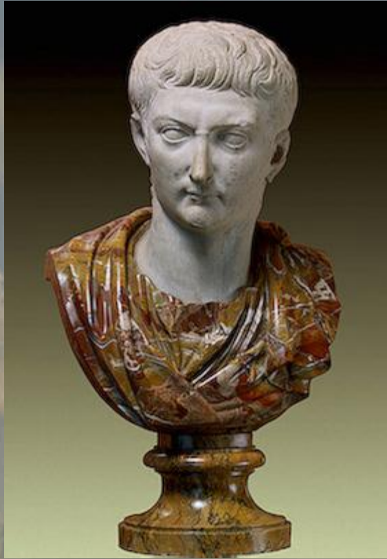
Портрет императора Тиберия

Не поверил император и заявил, что в это так же трудно поверить, как и в то, что это белое яйцо может стать красным. Пока он это говорил, на глазах у изумлённых людей белое яйцо изменило цвет на ярко-красный. С тех пор в память об этом событии, символизирующем нашу веру в Воскресшего Господа, мы и красим яйца.