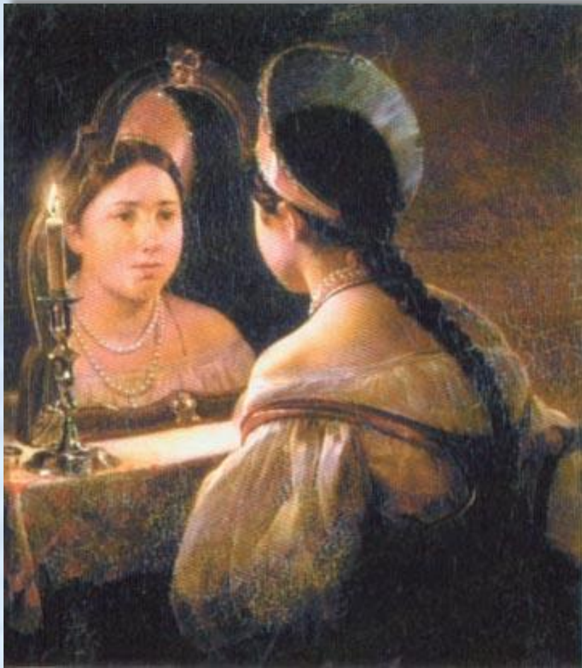
К.Брюллов. Гадающая Светлана

Татьяна любопытным взором На воск потопленный глядит: Он чудно вылитым узором Ей что-то чудное гласит; Из блюда, полного водою, Выходят кольца чередою; И вынулось колечко ей Под песенку старинных дней: «Там мужики-то всё богаты, Гребут лопатой серебро, Кому поем, тому добро И слава!..»