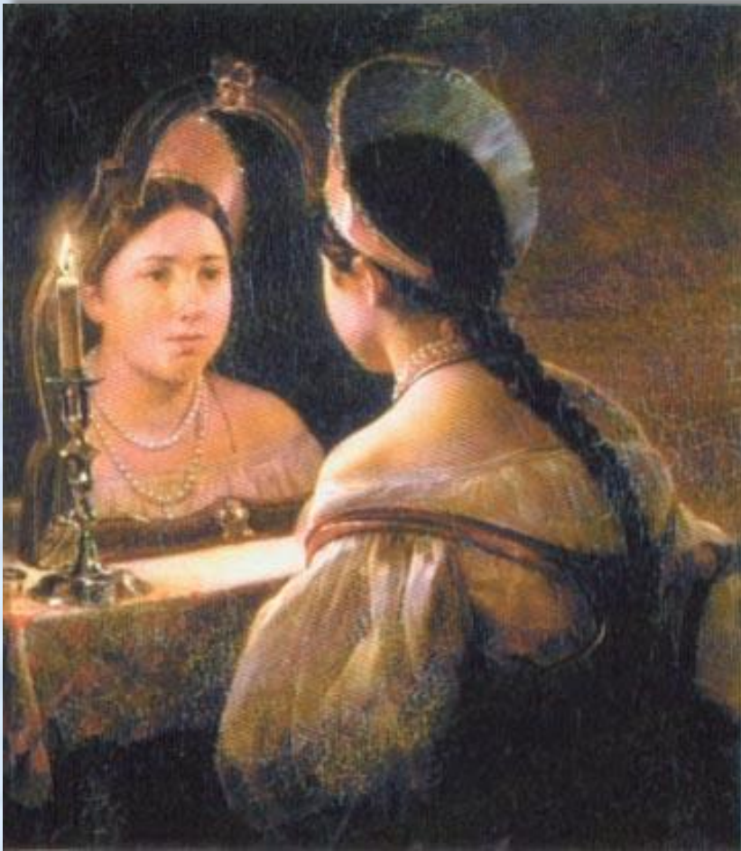
К.Брюллов. Гадающая Светлана

Татьяна любопытным взором На воск потопленный глядит: Он чудно вылитым узором Ей что-то чудное гласит; Из блюда, полного водою, Выходят кольца чередою; И вынулось колечко ей Под песенку старинных дней: «Там мужики-то всё богаты, Гребут лопатой серебро, Кому поем, тому добро И слава!..»