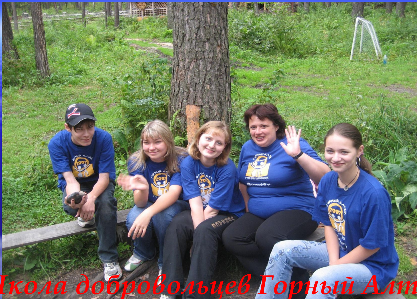
Школа добровольцев Горный Алтай Делегация города Березовского.