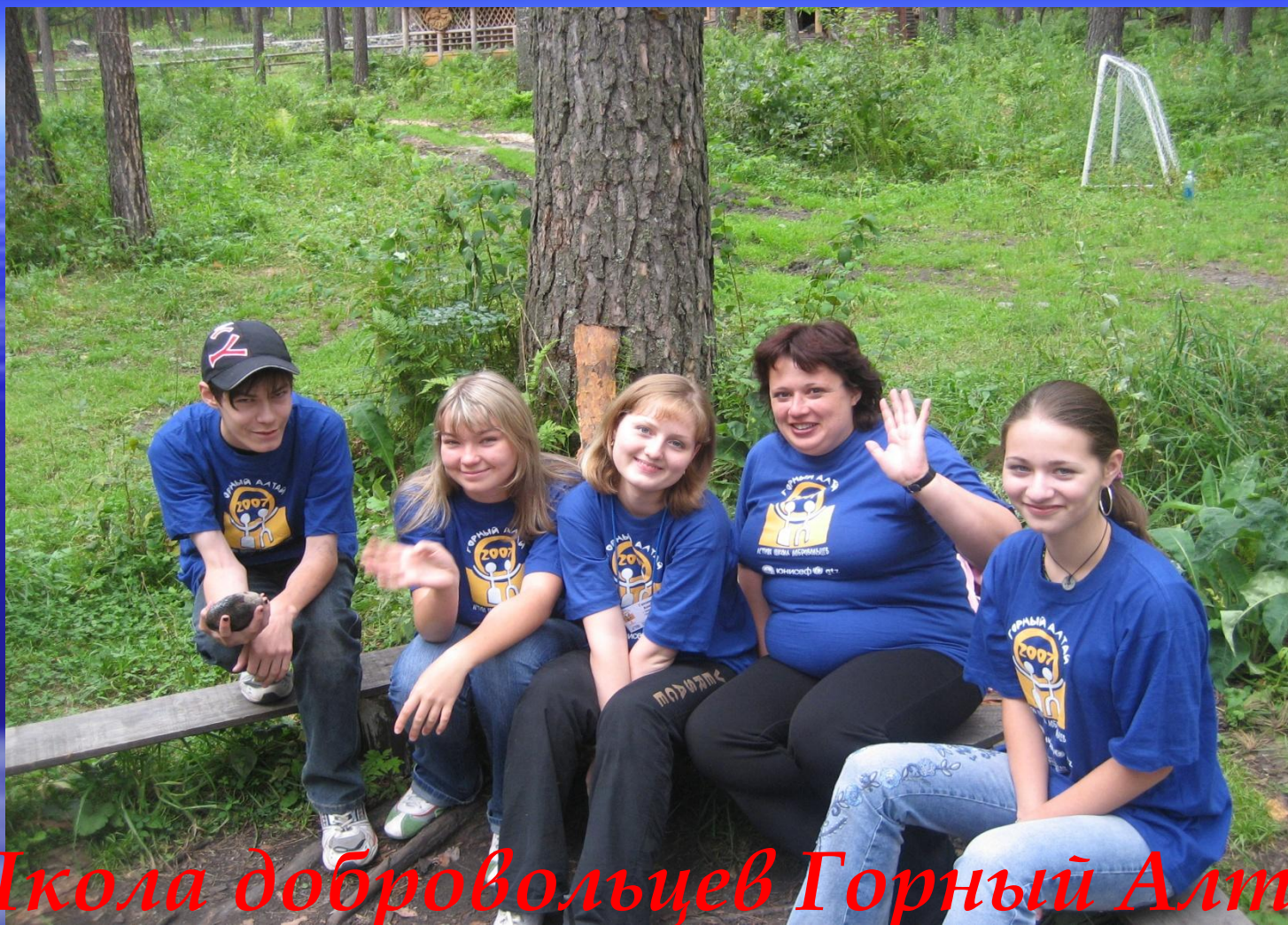
Школа добровольцев Горный Алтай Делегация города Березовского.