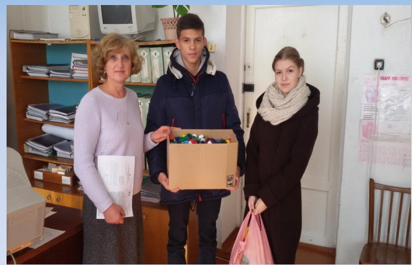
Волонтерський рух у школі