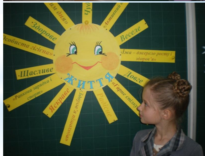
Вправа “ сенкан ”