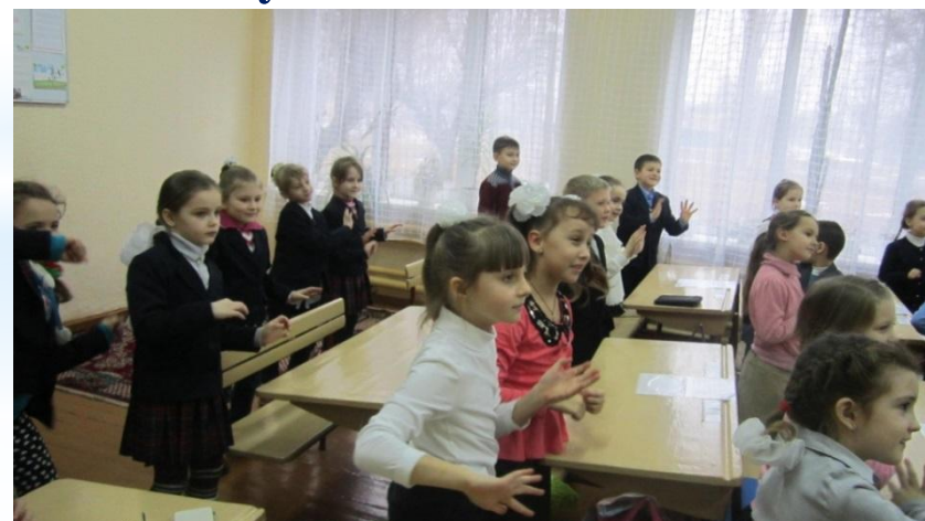
Грають у гру