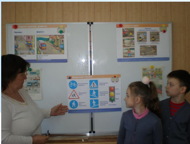
Гра «Дорожній знак допомагає»