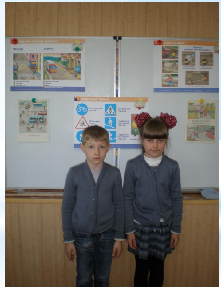
Розповідаємо про безпечну дорогу додому