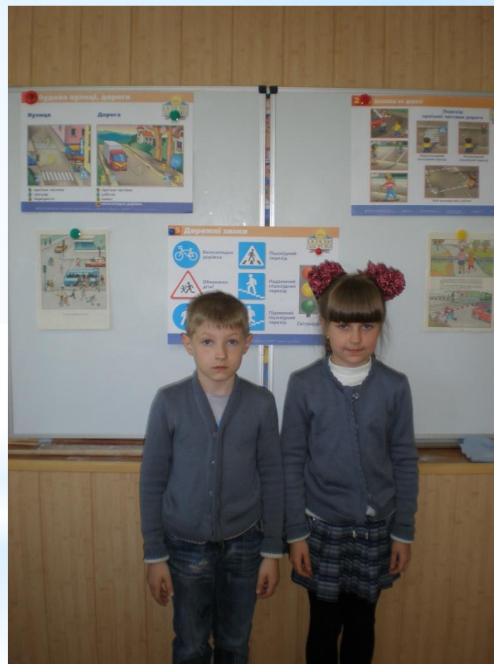
Розповідаємо про безпечну дорогу додому