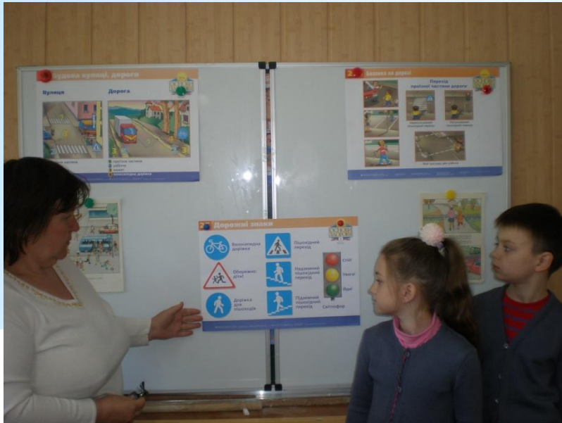
Гра «Дорожній знак допомагає»