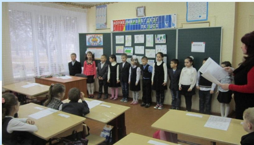
Учні розповідають вірші