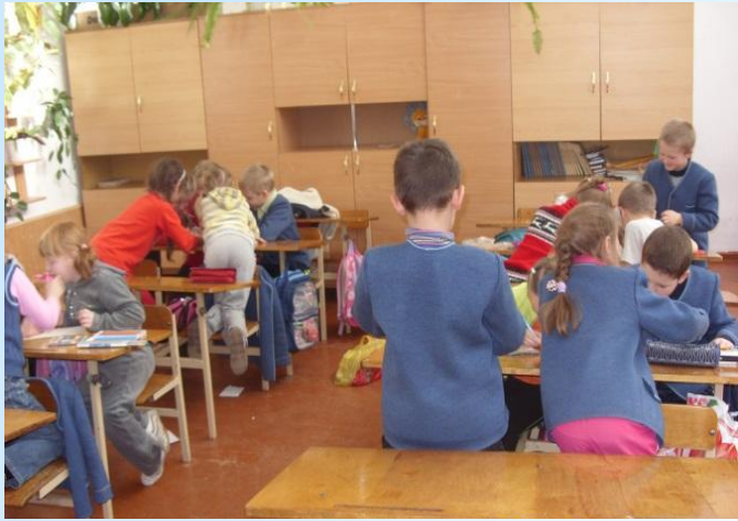
Працюємо у групах

Тиждень дорожнього руху 08 - 13 вересня 2014 року « Руху правила єдині - поважати їх повинні! »