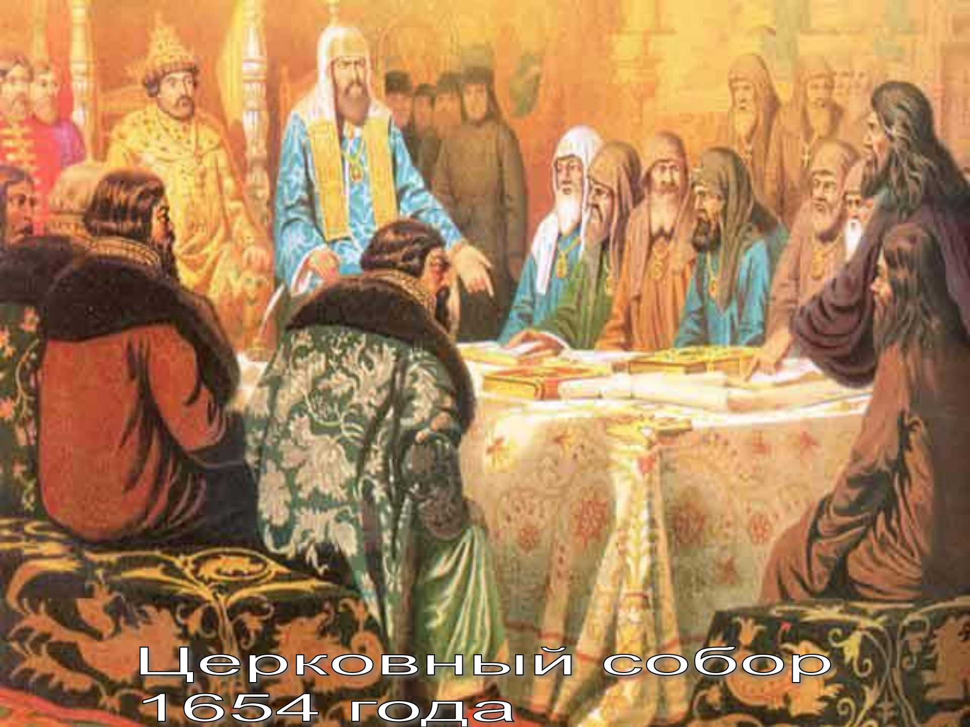
Церковный собор 1654 года