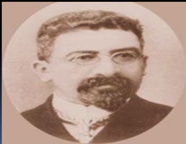
Брамсон Леонтий Моисеевич (1869–1941)