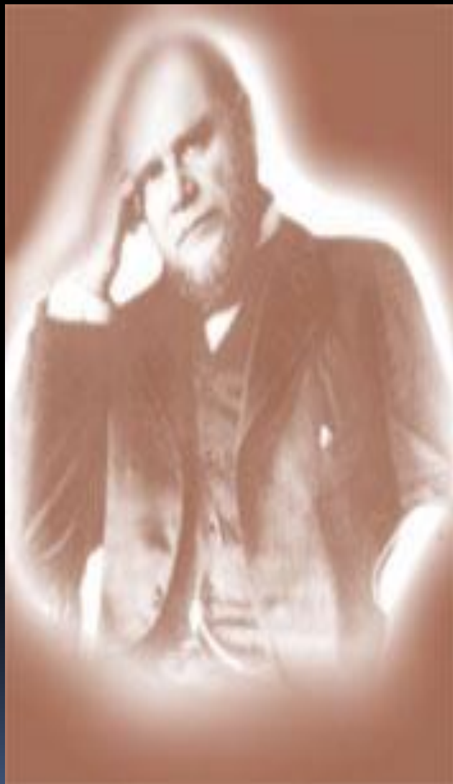
Кони Анатолий Федорович (1844-1927)

Ушедшие в себя эгоисты обыкновенно очень долго живут.