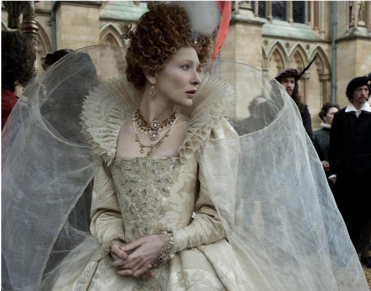
Английская королева Елизавета ввела в моду кружевной воротник.