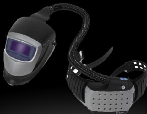
ЩИТОК С АВТОНОМНЫМ БЛОКОМ ПОДАЧИ И ОЧИСТКИ ВОЗДУХА