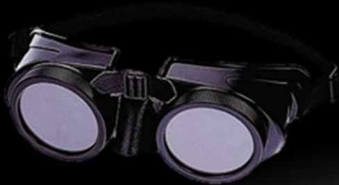
ОЧКИ ДЛЯ ГАЗСВАРКИ