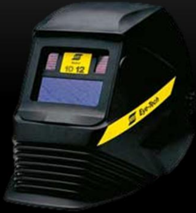
МАСКИ С АВТОМАТИЧЕСКИМ ЗАТЕМНЕНИЕМ