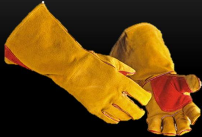
ПЕРЧАТКИ (КРАГИ СВАРЩИКА)