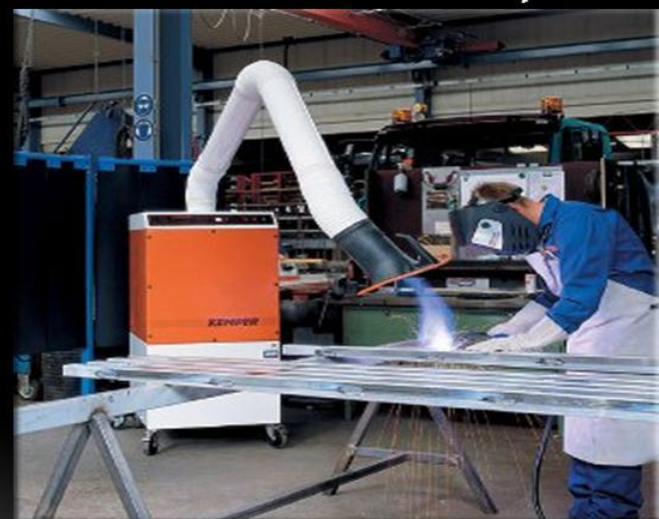
ВЫТЯЖКА СВАРОЧНЫХ ДЫМОВ