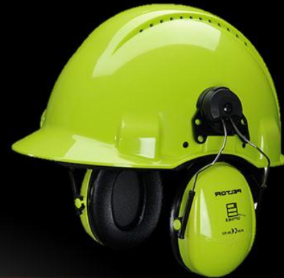
ЗАЩИТА ГОЛОВЫ И ОРГАНОВ СЛУХА