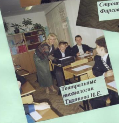
Театральные технологии Тихонова Н.Е.