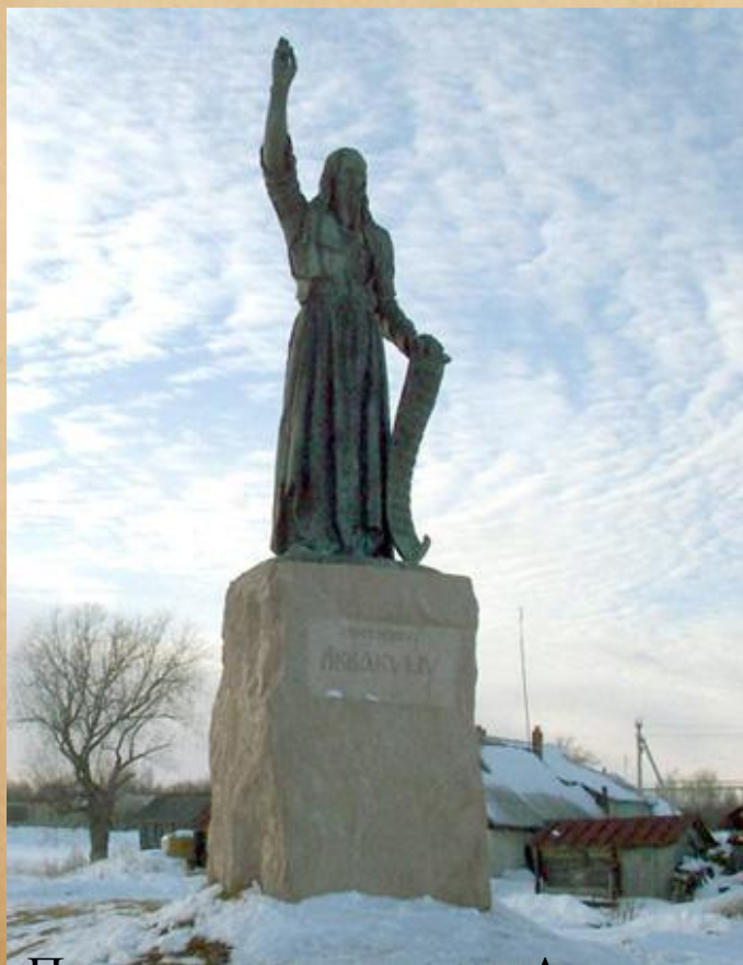
Памятник протопопу Аввакуму

Выступления Аввакума и других защитников «старой веры» получили поддержку в различных слоях русского общества, приобрели широкий размах и привёл к жестокому противостоянию двух сторон – защитников реформ в церкви и защитников старой веры.