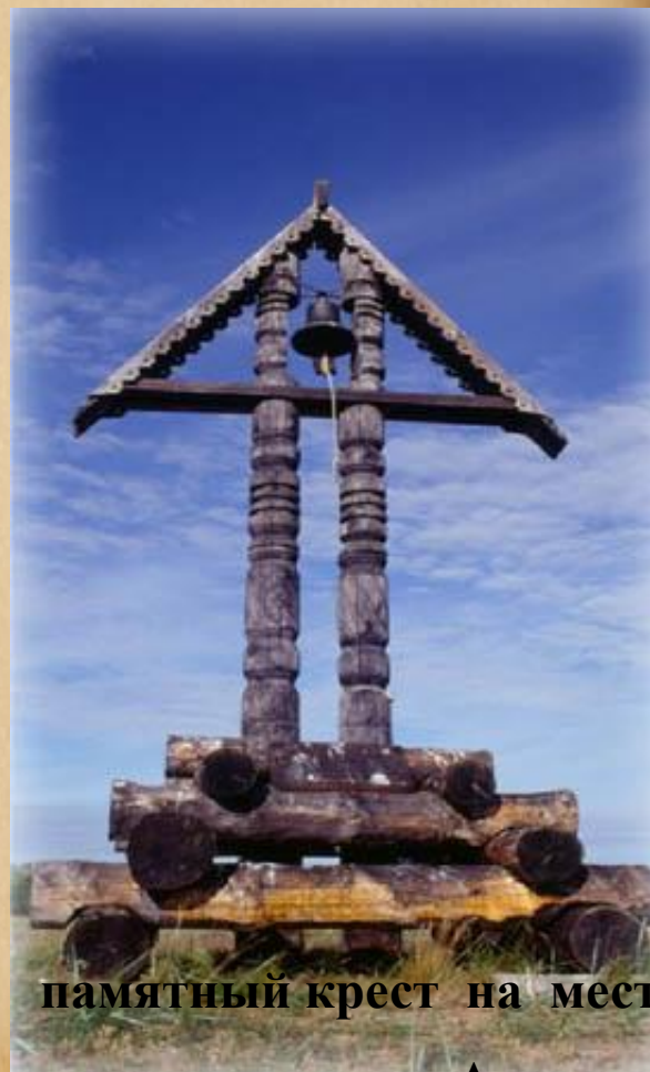
памятный крест на месте сожжения Аввакума